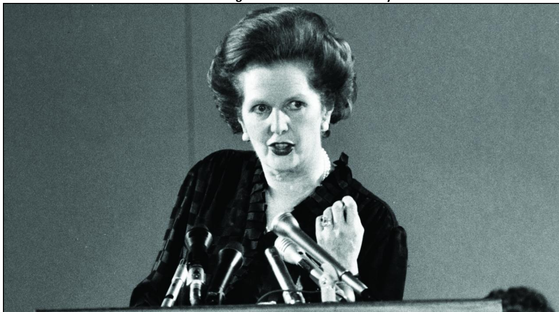
Slika 2 Margaret Thatcher – Čelična lady

Na Zapadu su žene u drugoj polovici 20. stoljeća postigle napredak, ali muškarci još uvijek imaju vodeće uloge u zakonima, politici, poslovanju i industriji. Jednostavno može se zaključiti da ženska prava nisu dosegla jednakost s ljudskim pravima, tj. s pravima koje muškarci imaju i primjenjuju ih u svojim životima. Žene tako rade potplaćene poslove, često su žrtve zlostavljanja i na radnim mjestima puno teže dolaze uopće do radnih mjesta.