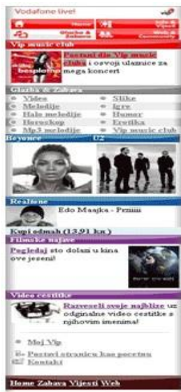
Slika 2 – Vodafone live portal