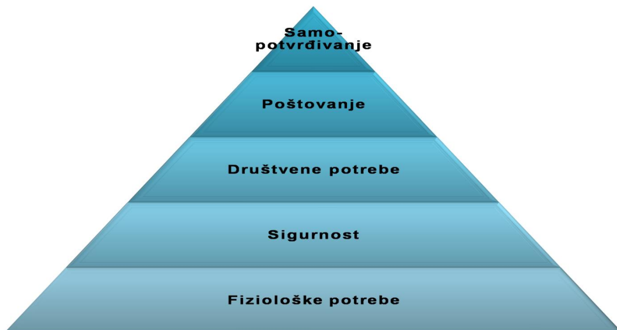
Slika 3 hierarhija ljudskih potreba