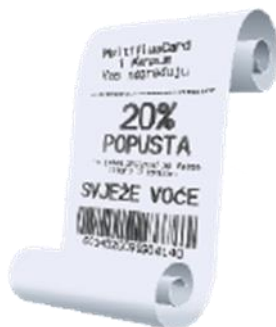
Slika 4 Račun s popustom