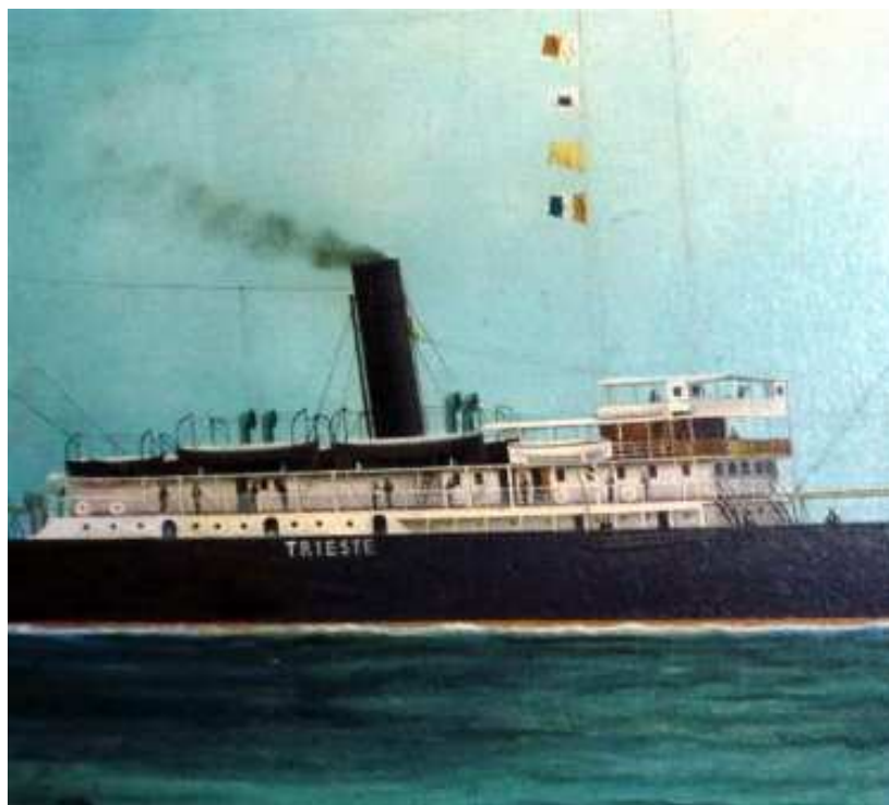
Slika 3. Parobrod