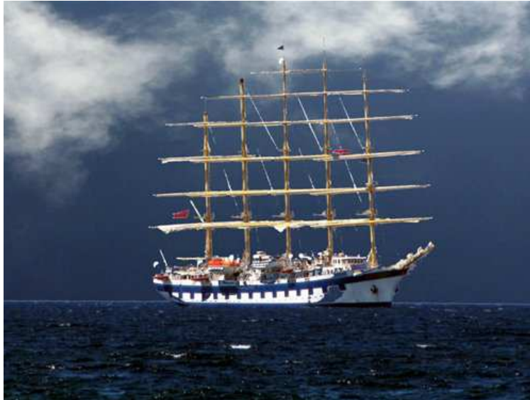
Slika 2. Jedrenjak- brod pogonjen vjetrom