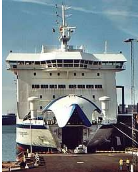
Slika 6. Ro – Ro brod s pokretnim pramcem za horizontalni pristup vozila u utrobu broda

posebno dolaze do izražaja u uvjetima zakrčenosti pojedinih luka, a njihove prednosti još više se povećavaju specijalnim terminalima.