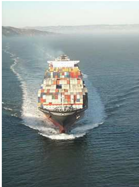
Slika 5. Kontejnerski brod

Neprekidan tranzit kontejnera (u svako doba, između 5 i 6 milijuna jedinica) povlači za sobom određeni obim rizika. Neki od tih rizika povezani su s ukrcajem i iskrcajem kontejnera, što između ostalog utječe na stabilitet broda. Bilo je slučajeva nestručnih utovarivanja kontejnera i sukladnih prevrtanja, što se nastoji izbjeći upotrebom kompjutorskih ukrcajnih sustava ( MACS3 ). Procijenjeno je da kontejnerski brodovi svake godine izgube preko 10 000 kontejnera za vrijeme plovidbe, u većini slučajeva za vrijeme nevremena ili uzburkanog mora, što stvara ekološku prijetnju.