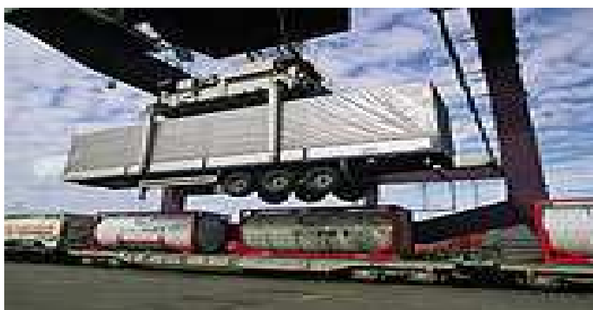
Slika 10. HUCKEPACK tehnologija