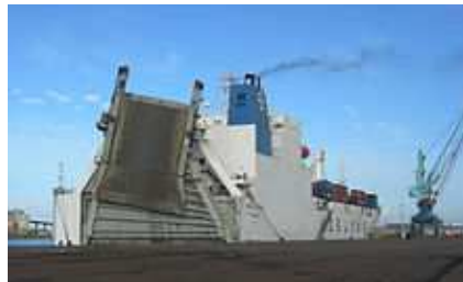
Slika 7. Ro – Ro brod