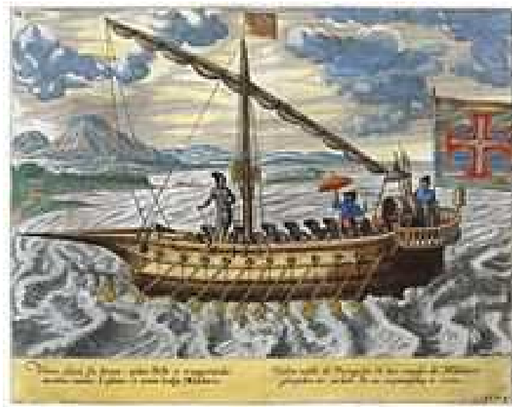
Slika 1. Brod na vesla

Vodni promet razvijao se usporedno s kopnenim prometom. Čovjek je vrlo rano koristio jednostavna plovna sredstva kao što su: brod na vesla koji se upotrebljavao već u kamenom dobu, te jedrenjak koji datira iz brončanog doba. Krajem 18. stoljeća dolazi do uporabe odnosno primjene parnog broda . Krajem 19. i početkom 20. stoljeća ugrađivali su se u brodove pogonski agregati odnosno motori pogonjeni naftnim derivatima kao što je: mazut, diesel, benzin, petrolej kao izvorišta energije. U drugoj polovici 20. Stoljeća počinje primjena atomske energije kao izvorišta u pogonu brodova u procesu duljeg vremenskog plovidbenog perioda na moru bez dopune spremnika drugom vrstom energenata. Izgradnja i upotreba brodova uvjetovala je i izgradnju posebnih mjesta za pristajanje brodova