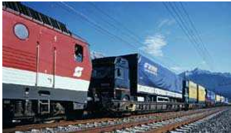
Slika 8. HUCKEPACK tehnologija A