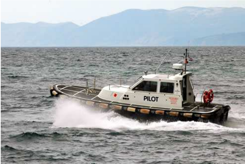
Slika 4. Brod za peljarenje