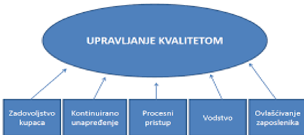
Slika 2. Upravljanje kvalitetom