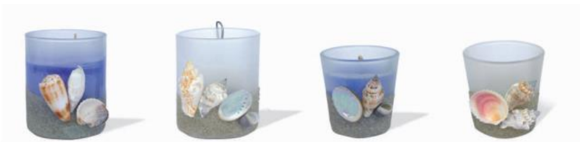
Slika 6: Morske svijeće