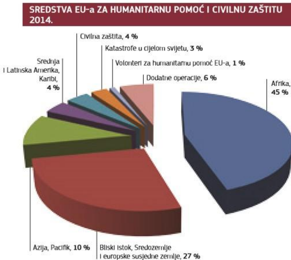
Slika 2. Godišnji prikaz sredstava EU-a za humanitarnu pomoć i civilnu zaštitu za 2014. godinu