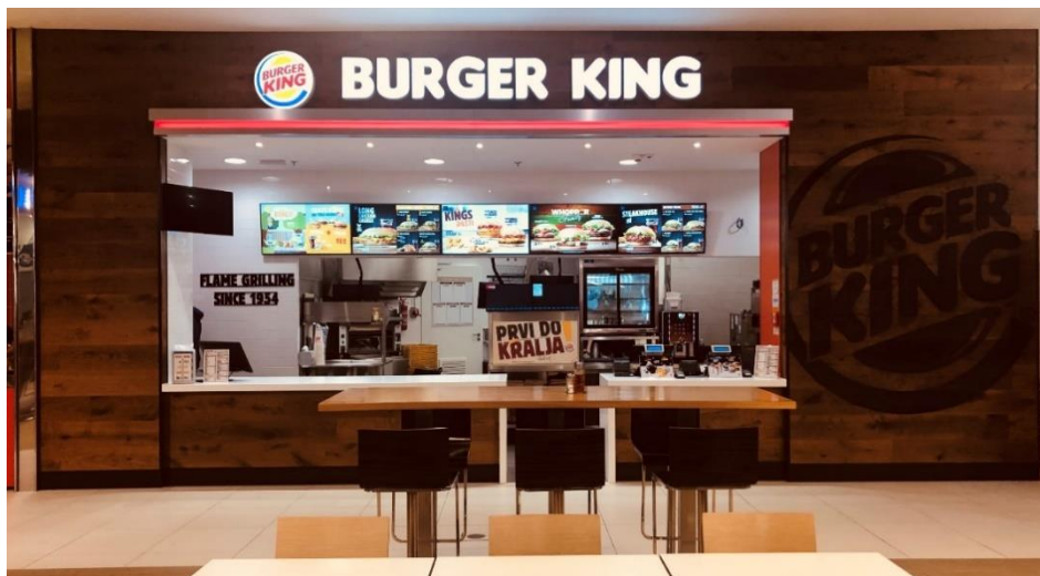
Slika 2: Burger King Split