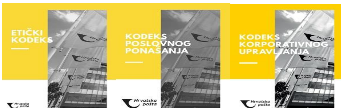
Slika 3: Temelji organizacijske kulture