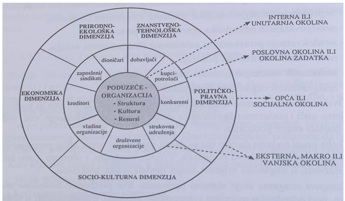
Slika 1: Ključne dimenzije interne i eksterne okoline