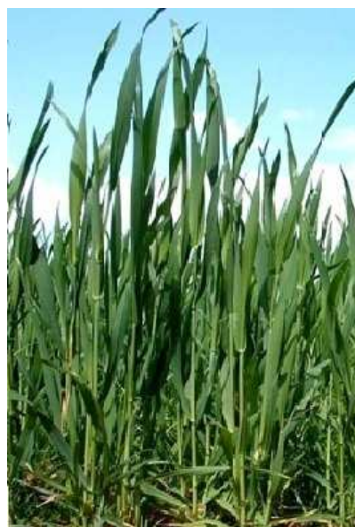
Slika 6. Pšenica u fazi vlatanja