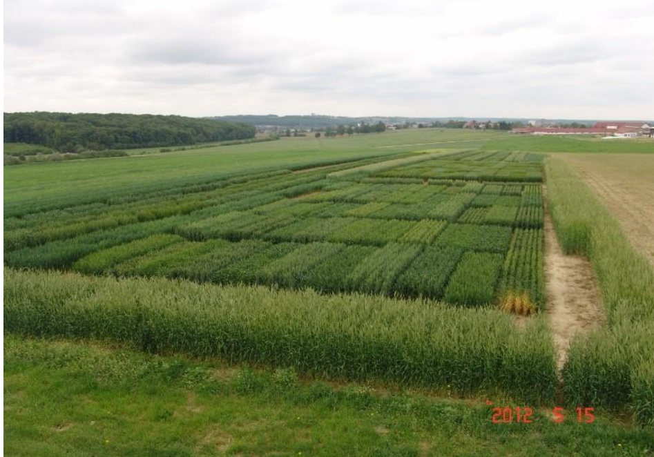
Slika 2: Konvencionalna proizvodnja na Visokom gospodarskom učilištu u Križevcima