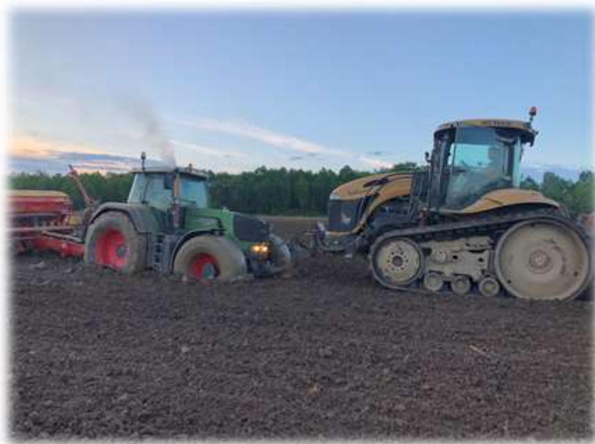
Slika 4. Sjetva u poljoprivrednom poduzeću Agro Land

U promatranom razdoblju za 2018. godinu upravo se navedenom sijačicom posijalo 900 ha oranica. Na oranicama u vlasništvu poduzeća Agro Land posijano je 50 ha, dok je uslužno posijano 850 ha oranica. Cijena sjetve 1 ha iznosi 350 kn.