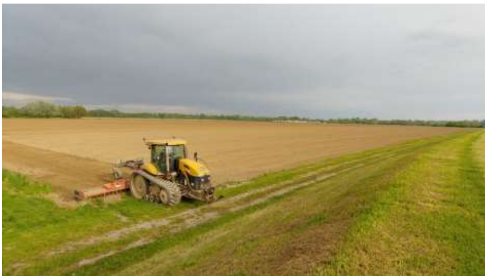
Slika 3. Roto drljanje u poljoprivrednom poduzeću Agro Land