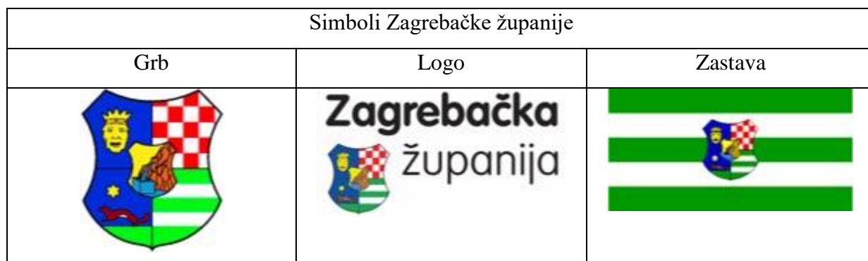
Tablica 1. Simboli Zagrebačke županije

Zagrebačka županija nalazi se u središnjem djelu sjeverozapadne Hrvatske. Sjedište županije nalazi se u Zagrebu. Površinom je šesta po redu, tj. po veličini županija u Hrvatskoj. Prema broju stanovnika, to je treća najveća županija u Hrvatskoj (nalazi se iza Grada Zagreba i Splitsko-dalmatinske županije) ( www.zagrebacka-zupanija.hr , 2019). U sljedećoj tablici nalaze se simboli Zagrebačke županije prema kojima ova županija ima svoju prepoznatljivu grafičku vizuru (Tablica 1).