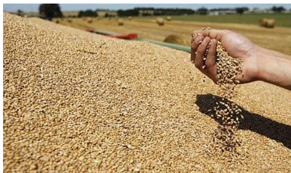
Slika 2. Pšenica

Cilj ovog istraživanja je stvoriti pšenicu visoke kakvoće približno slične onoj u Divane, ali poboljšane otpornosti prema polijeganju,prevalentnim bolestima i poboljšane rodnosti.