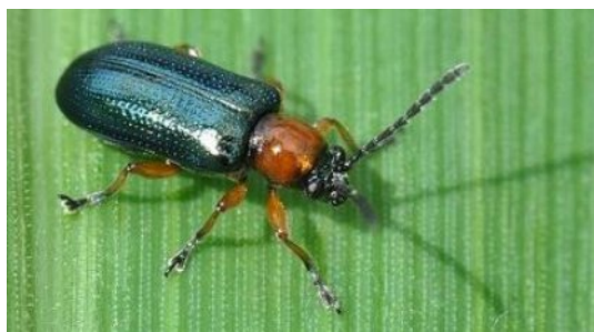
Slika 6. Žitni balac