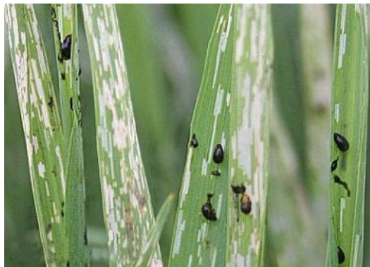
Slika 5. Žitni balac

oblika traje dvadesetak dana što se kasnije manifestira na razvučenu pojavu ličinki. Odrasli oblici prave štete hraneći se listom tako da ga progrizaju čineći na listovima uske pruge. Sve češće ovoga štetnika nalazimo i na kukuruzu gdje na listovima čini isto takove štete. Nakon kopulacije ženke odlažu jaja na naličje lista u nizu po nekoliko, ali se mogu naći i pojedinačno odložena jaja. Za razvoj ličinke iz jaja potrebno je od 6 - 18 dana što ovisi o dnevnim temperaturama. Ličinke ili u narodu često nazivani „pužići“ javljaju se od kraja travnja i u svibnju. Ove godine prve ličinke smo primijetili 5 svibnja na ozimoj zobi. Ličinke su u početku žućkaste boje, kasnije od izmeta i sluzi poprime tamniju boju. Razvoj ličinke do odraslog oblika traje 10 - 22 dana. Ličinke se također hrane lišćem, izgrizajući ga u vidu uskih pruga s tim da epiderma ostaje neoštećena. Pruge se spajaju pa dobivamo bijeli list.