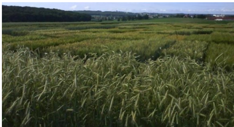
Slika 7. Pokusnopoljepšenice