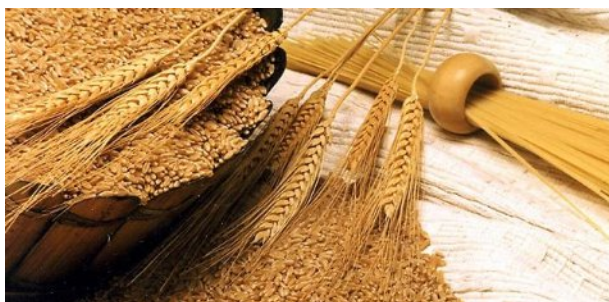
Slika 1. Upotreba pšenice