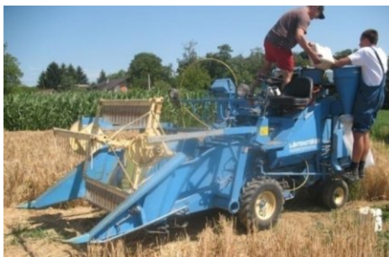
Slika 9. Žetva mikropokusa pšenice