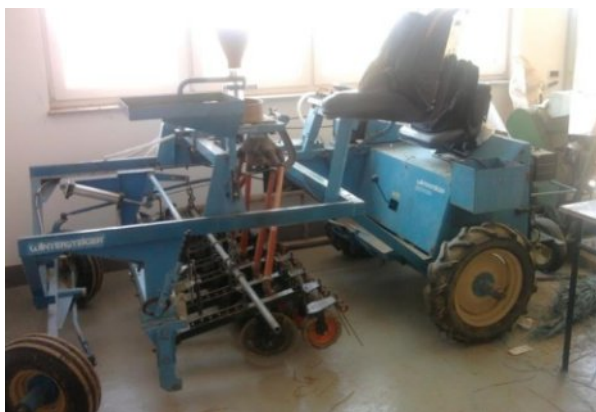
Slika 3. Sijačica za sjetvu pšenice za posebne namjene