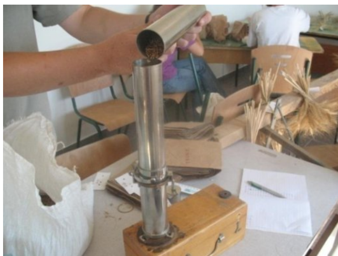
Slika 10. Određivanje hektolitarske težine

Određivanje Hl-težina sjemena na Schopperovoj vagi( slika 10. )- Ispitni uzorak uzima se lopaticom i stavlja do oznake u cijev za nasipavanje. Mlaz sjemena mora padati u sredinu cilindra, a sjeme se ne smije poravnati s rubom cilindra. Pridržavajući mjerni cilindar nož brzo, ali bez potresa, treba izvući pri čemu klip, zajedno sa sjemenom iznad njega, naglo pada na dno cilindra. Tada se nož ponovno uvuče u prorez, sjeme iznad njega se potpuno ukloni, nož se izvuče, a sadržaj iz cilindra važe. Za dobivenu odnosno očitane masu zrna iz tablice se pročita vrijednost iskazana u kilogramima. Dobivena se vrijednost pomnoži sa 10 i dobiva se «hektolitarska masa» iskazana u kg/m 3 . Uz dobar urod hektolitarska masa svih varijanata bila je veća od 76 kg/hl, što je prema Pravilniku o žitaricama, mlinskim i pekarskim proizvodima, tjestenini, tijestu i proizvodima od tijesta NN 78/05 ikoja se može koristiti u pekarskoj industriji.