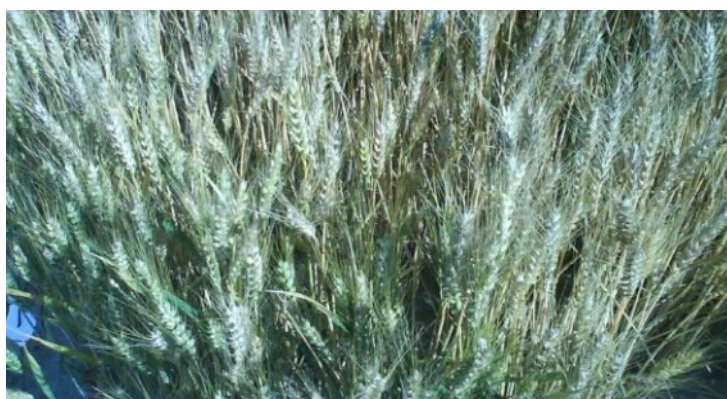
Slika 8. Pšenica

Kombajniranje je obavljeno 05. srpnja 2012. godine, specijalnim samočistačem kombajnom marke Wintersteiger zahvata 1m za žetvu mikro pokusa ( slika 9. ). Nakon kombajniranja očistili smo dobiveni prirod svake varijante od primjesa, te ga izvagali. Dobivena masa izražena je u kilogramima. Za svaku od 7 varijanti u I.,II.,III.,IV.i V. repeticiji izračunali smo prosječni prirod po hektaru.