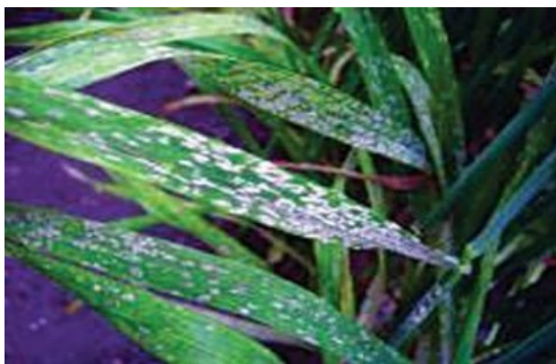
Slika 4. Pepelnica na listu pšenice