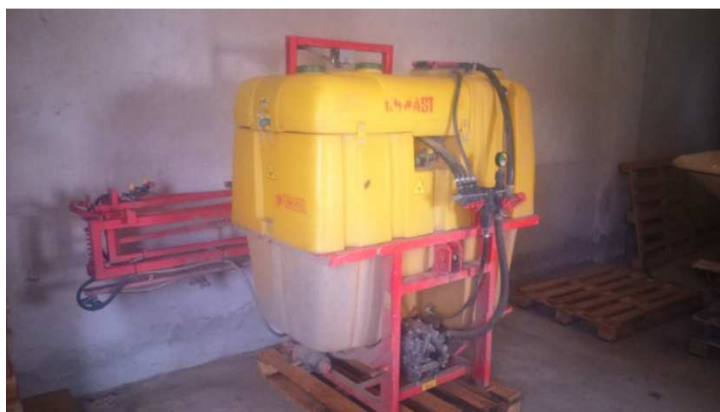
Slika 4. Prskalica, AKPIL 800 l

Zaštita protiv korova provedena je 3. ožujka 2015. herbicidom Alistergrande 0,8 l/ha. Prva zaštita protiv bolesti provedena je 16. travnja 2015. fungicidom Falcon 0,6 l/ha, a druga 12. svibnja 2015. fungicidom Prosaro 1 l/ha + Biscaya 0,3 l/ha (prskalicom AKPIL zapremine 800 l, širine zahvata 12 m).