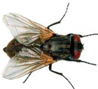
Slika 2. Muha ( Muscidae )

Čovjekova je odgovornost velika jer neumjerenom upotrebom insekticida i akaricida ugrožava prirodnu ravnotežu, pa je tako dokazano da pri zamagljivanju šumskih biocenoza strada 50 % štetnih i 50 % korisnih insekata. U slobodnoj prirodi, upotrebom insekticida stradavaju ptice, ribe, vodozemci, a najveće su zabilježene štete zbog trovanja pčela, ako nisu pravovremeno obaviješteni pčelari da u vrijeme dezinsekcije ne puštaju pčele iz košnica.