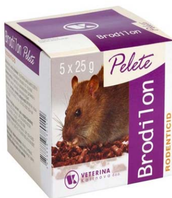
Slika 6. Brodilon mamac

- antikoagulanti druge generacije ( difenakum , bromadiolon i brodifakum ).