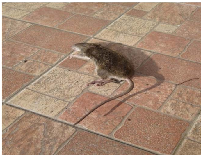
Slika 5. Štakor selac