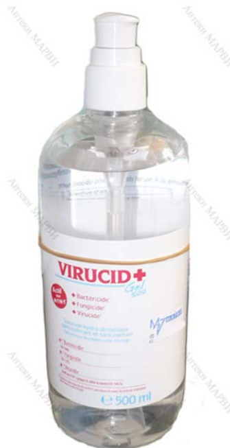
Slika 1. Dezinfekcijsko sredstvo Virucid