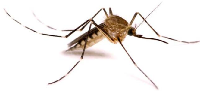
Slika 3. Komarac ( Culicidae )