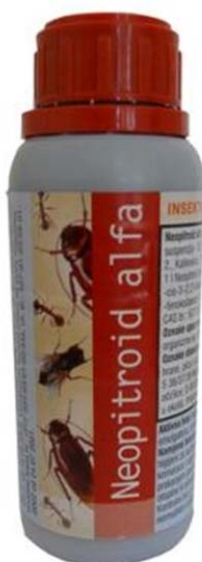
Slika 4. Sredstvo za dezinfekciju Neopitroid alfa