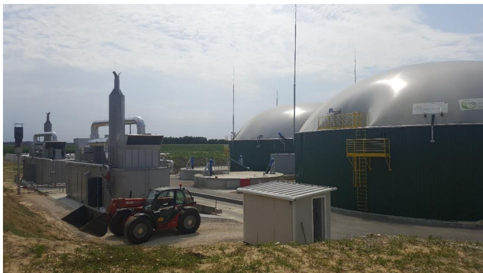
Slika 14: Bioplinara Organica Kalnik 1 d.o.o.

Na gospodarstvu Čakija odlučili su se dio proizvedenog silažnog kukuruza prodati u bioplinaru za potrebe proizvodnje bioplina. Krenulo se silirati 10. rujna 2015. Siliranje je provedeno samohodnim silokombajnom, a transport zelene mase s polja do bioplinare obavljen je sa 7 traktora i prikolica. Na ulazu u bioplinaru svaka prikolica je posebno vagana, zatim je zelena masa istovarena u horizontalne silose u bioplinari i opet se išlo na vagu, kako bi se dobila točna neto količina istovarene zelene mase. Svakom prikolicom je prosječno dovezeno 10 tona zelene mase. Budući da nije bilo većih kvarova, siliranje na OPG Čakija obavljeno je u jednom danu. Cijena 1 kilograma zelene mase bila je 25 lipa, a isplaćivanje otkupljene zelene mase obavljeno je u roku jednog mjeseca preko računa.