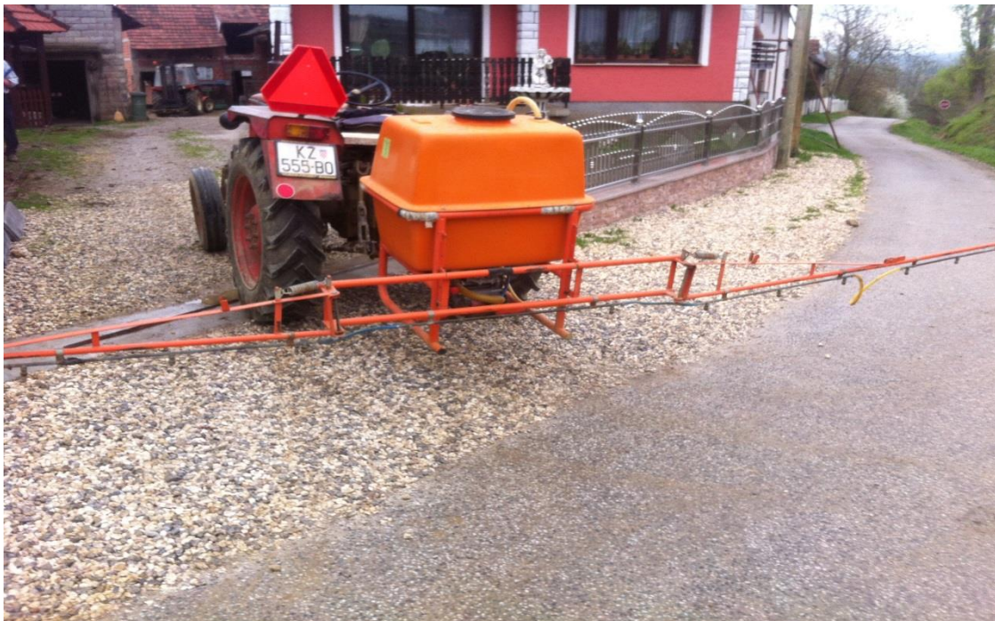
Slika 7. Traktorska prskalica