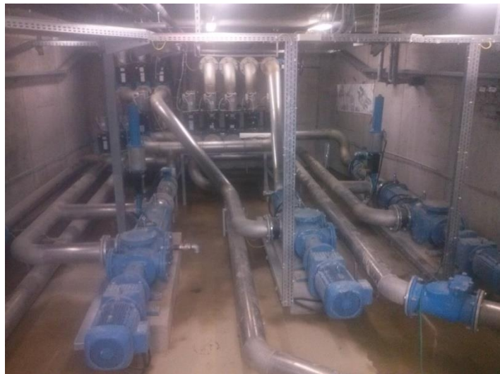
Slika 17: Crpne pumpe