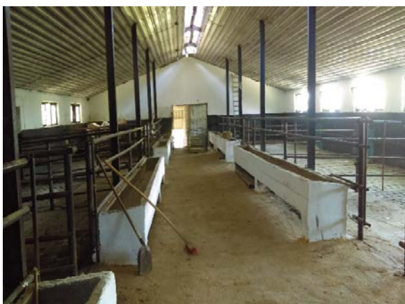
Slika 12. a i b Očišćeni boksovi