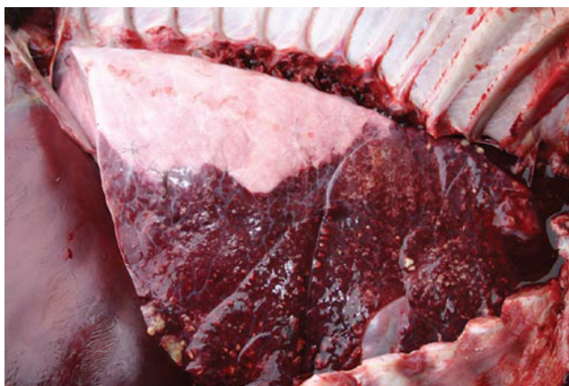
Slika 21. Enzootska pneumonija goveda