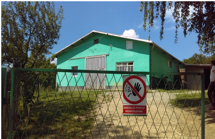
Slika 17. Pogled na gospodarstvo

Cilj rada bio je istražiti zdravstveno stanje stada u tovu. Podaci su prikupljeni iz knjige evidencije liječenih životinja na gospodarstvu te metodom ankete vlasnika gospodarstva.