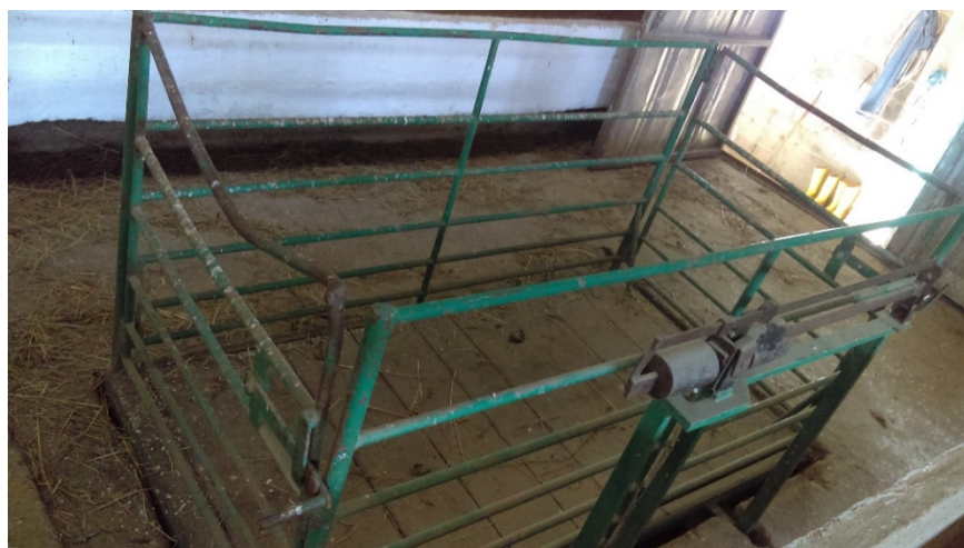
Slika 18. Stočna vaga na farmi

Poznavanje tjelesne težine je osnova pravilne ishrane i uspješnosti tova. Nije dobro često vagati zbog uznemiravanja tovljenika, što se negativno odražava na prirast. Tehnička oprema za vaganje mora biti funkcionalna da se životinja izvaže na najlakši i najkraći način. To se postiže montažnim hodnicima do i od vage koja je smještena u istoj razini (slika 19). Životinje je potrebno vagati minimalno 2 puta i to na početku i na kraju tova, a u međufazama po potrebi. Goveda se važu u pravilu nakon 12 sati posta.