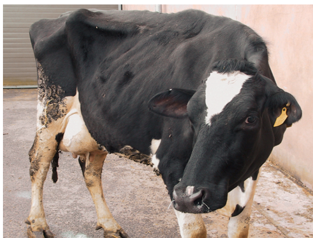
Slika 22. Mršavo govedo

Liječenje valja produljiti i 2 dana nakon smirivanja znakova bolesti. Odraslim preživačima lijekovi se mogu davati isključivo injekcijski. Antibiotik se može davati na usta samo teladi koja još nije postala preživač (Bayer, Veterina Hrvatska, IP 11 ).