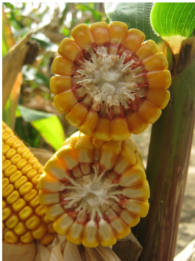
Slika 1. Klip hibrida „Drava 404“