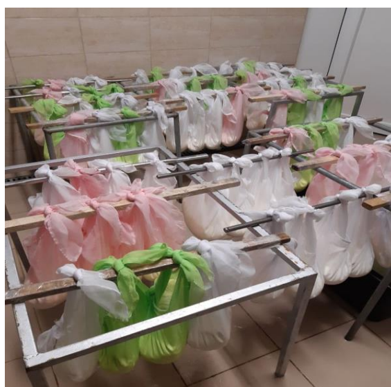
Slika 2. Cijedenje svježeg sira