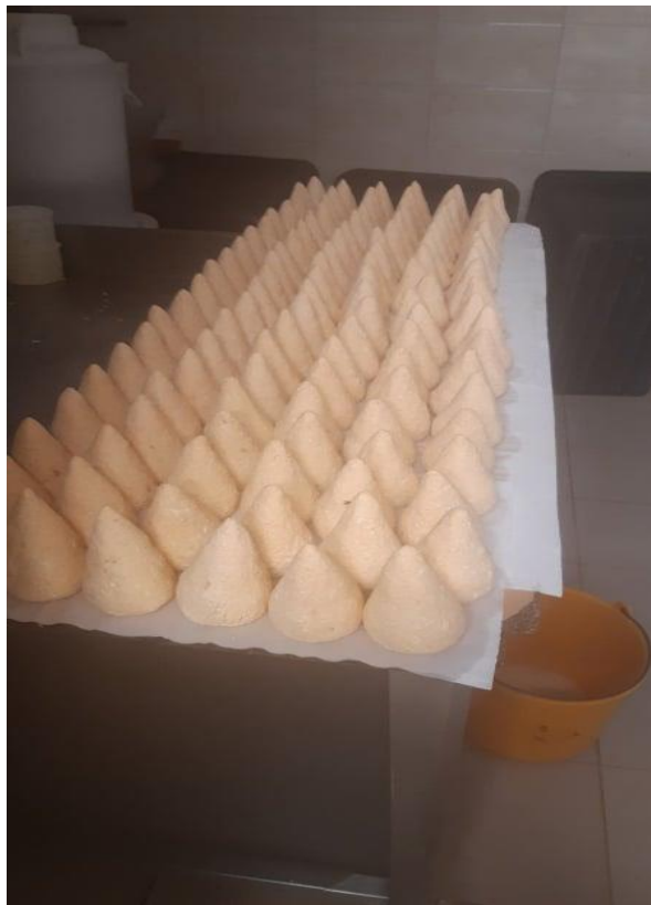
Slika 4. Proizvodnja Prgica

Prgice se proizvode od svježeg sira (tehnologija je opisana na prethodnoj stranici). Svježi sir se dobro ocijedi i izmiješa, dodaje mu se sol i crvena mljevena ljuta paprika (a može po volji i češnjak) zbog postizanja karakteristika sira (bolje postojanosti i boljeg okusa sira). Nakon što se dobro izmiješa, rukama se formiraju stošci koji se stavljaju na dimljenje u sušaru. Dimljenje traje oko 1 h i 30 minuta. Prgice se do prodaje čuvaju u hladnjaku na +4 do +8°C, a prodaju se kao nezapakirani proizvod (u vrećicama za zamrzavanje).