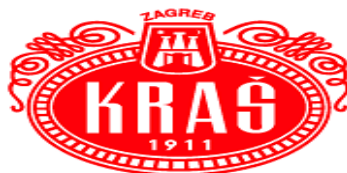
Slika 4. Logotip poduzeća Kraš d.d.