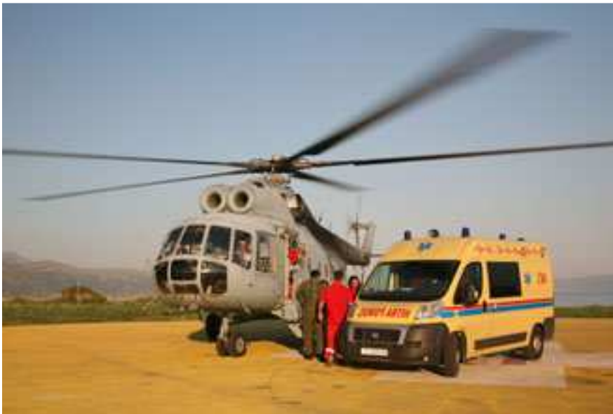
Slika 2. Eskadrila transportnog helikoptera tokom hitne intervencije sa ekipom hitne medicinske službe

Unatoč postojanju HHMS, posade HRZ i PZO nisu stali sa svojim djelovanjem, te su tokom 2015. godine ostvarili 1366 letova medicinskog prevoženja, 464 medicinske intervencije sa 510 prevezenih pacijenata (21).