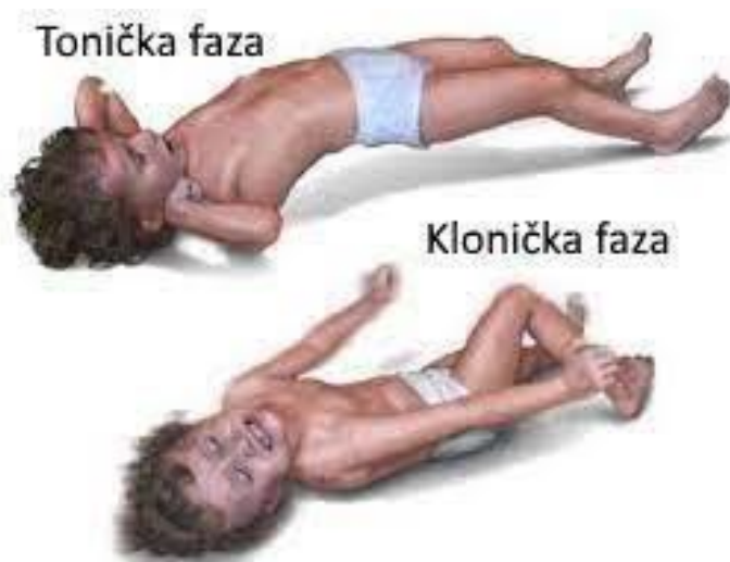
Slika 3.1. Prikaz toničke i kloničke faze (6)