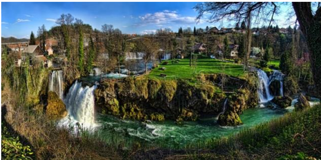
Slika 4: Rastoke, vodeničarsko naselje