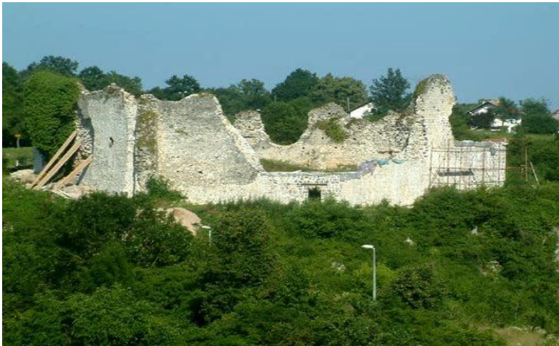
Slika 2: Stari grad Slunj