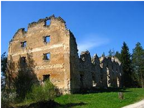
Slika 3: Napoleonov magazin