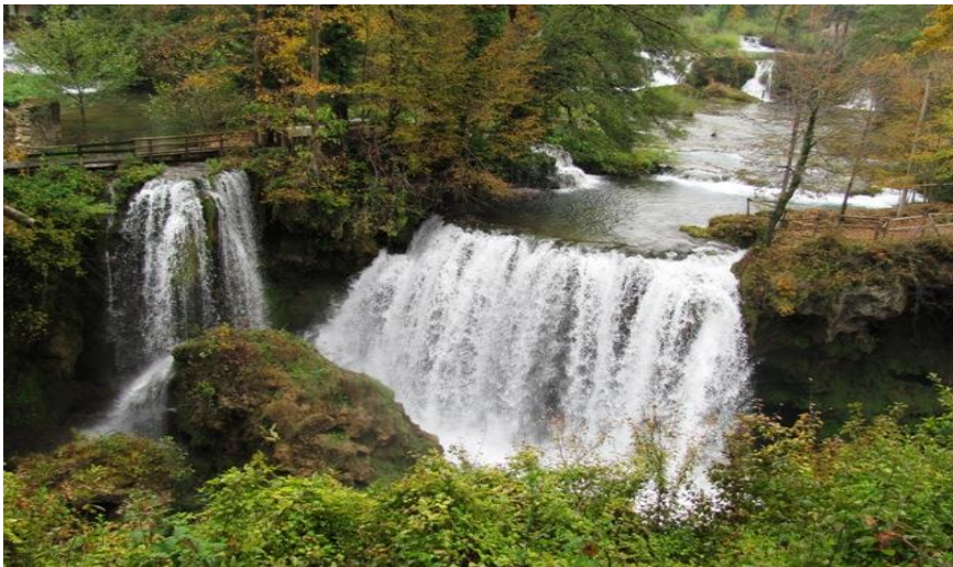
Slika 1: Rastoke, sedreno slapište