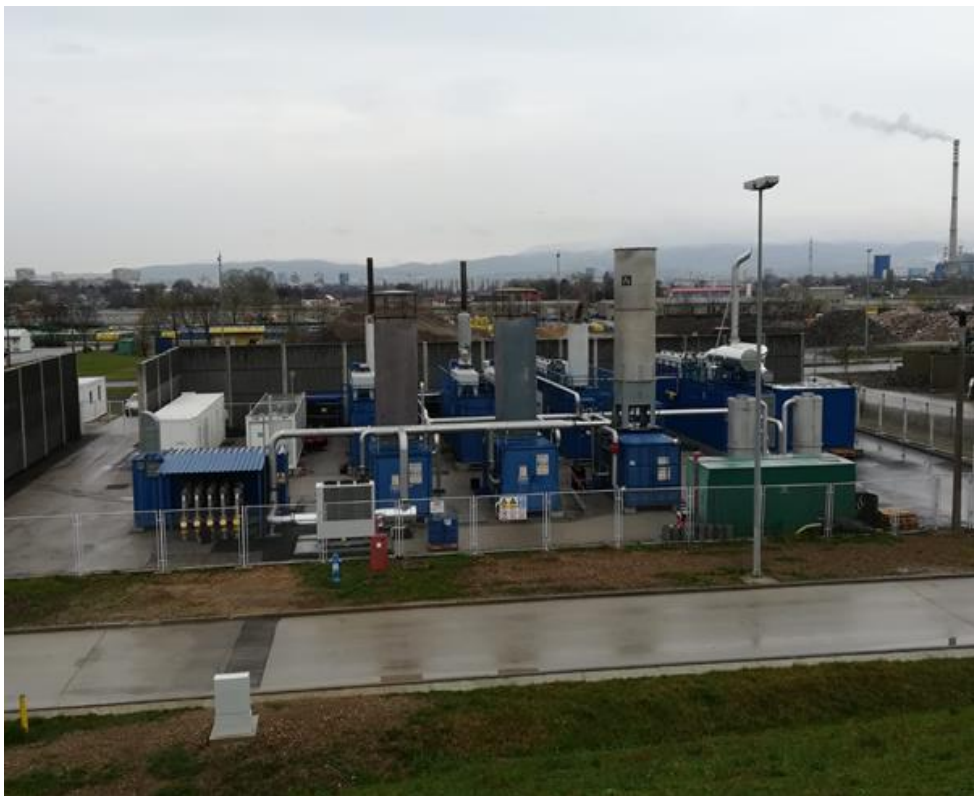
Slika 10. postrojenje za gospodarenje plinom

mTEO plinsko postrojenje je postrojenje u kojem se stvara električna energija, a od prosinca 2004. do lipnja 2020. godine u postrojenju je proizvedeno 148.473 MWh električne energije (ANONYMOUS c, 2020.).