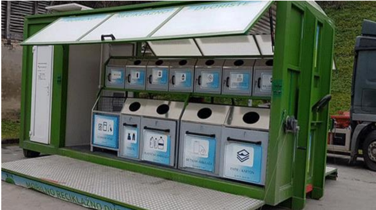
Slika 5. Mobilno reciklažno dvorište

Recovery: regeneracija materijala i energije je postupak kojim se kemijskom, fizikalnom i toplinskom pretvorbom materijala ponovno proizvodi materijal ili energija (BULJAN, 2020.).