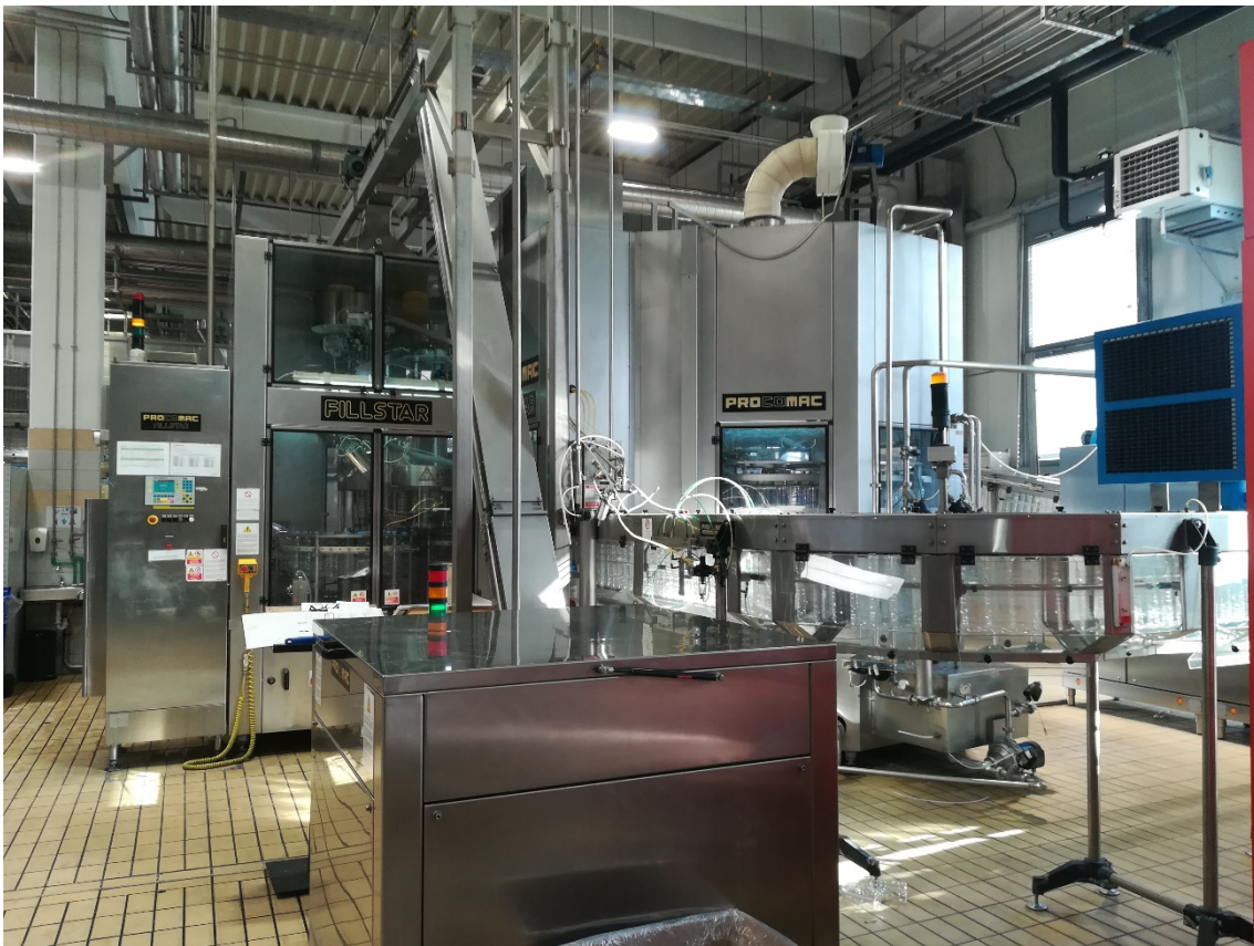
Slika 4. Blok punjača sa trakom za prijenos pet ambalaže.

Iz „puffer“ tanka voda se transportira kroz mikro filtre do bloka punjača. Blok punjača se sastoji od punjača i čepilice. Proces je takav da boce ulaze u punjač pomoću transportne trake od strane depaletizatora te ih zahvaća rotirajuća ulazna zvijezda. Prilikom prolaska boce se ispiru te se pune vodom i vanjskom zvijezdom se transportiraju do čepilice. Čepovi se stavljaju u spremnik čepova kojim se čepovi spuštaju do čepilice. Pet ambalaža prije dolaska u blok punjač (slika 4.) mora proći kroz puhaljku kako bi dobili željeni oblik boce.