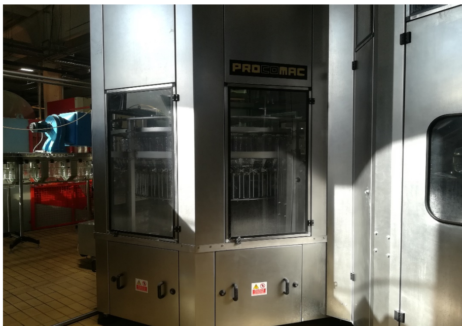
Slika 19. Prikaz stroja sa čvrstom zaštitnom napravom.