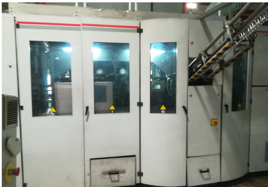
Slika 6. Puhaljka za predoblike sa transportnom trakom.

Ukoliko boce zadovoljavaju sve propisane uvjete nakon izlaska iz blok punjača, one se zatim transportiraju do etiketirke (slika 7.). Etiketirka je automatski stroj namijenjen za apliciranje etiketa na pet ambalažu.