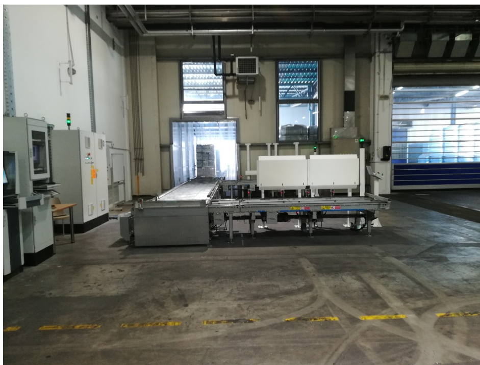
Slika 10. Transportni tunel iz proizvodnog pogona prema skladištu.

Nakon formiranja, paleta se omotava „stretch“ folijom te se nakon omotavanja označava i robot viličar ju odvozi do transportnog tunela (slika 10.).