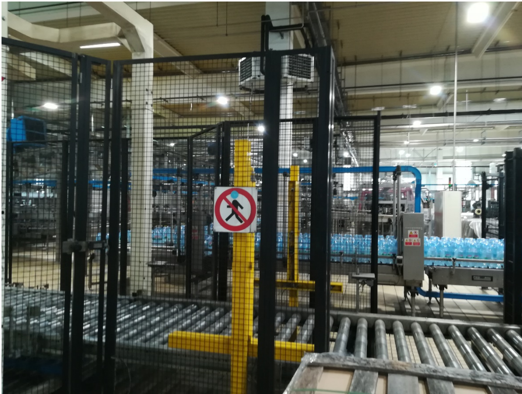
Slika 23. Slika znaka zabranjeno kretanje.

Iduća mjera zaštite su znakovi upozorenja kako bi se označilo da se iza ograde nalazi opasnost i da se treba zadržavati dalje od radnog prostora stroja jer može doći do ozljeda po osobi koja ih se ne pridržava (slika 23.).