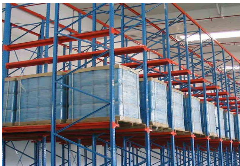
Slika 11. Regalno skladište.

Nakon izlaska formirane palete, viličarist je pomoću električnog viličara preuzima na izlazu i skladišti u regalno skladište (slika 11.).