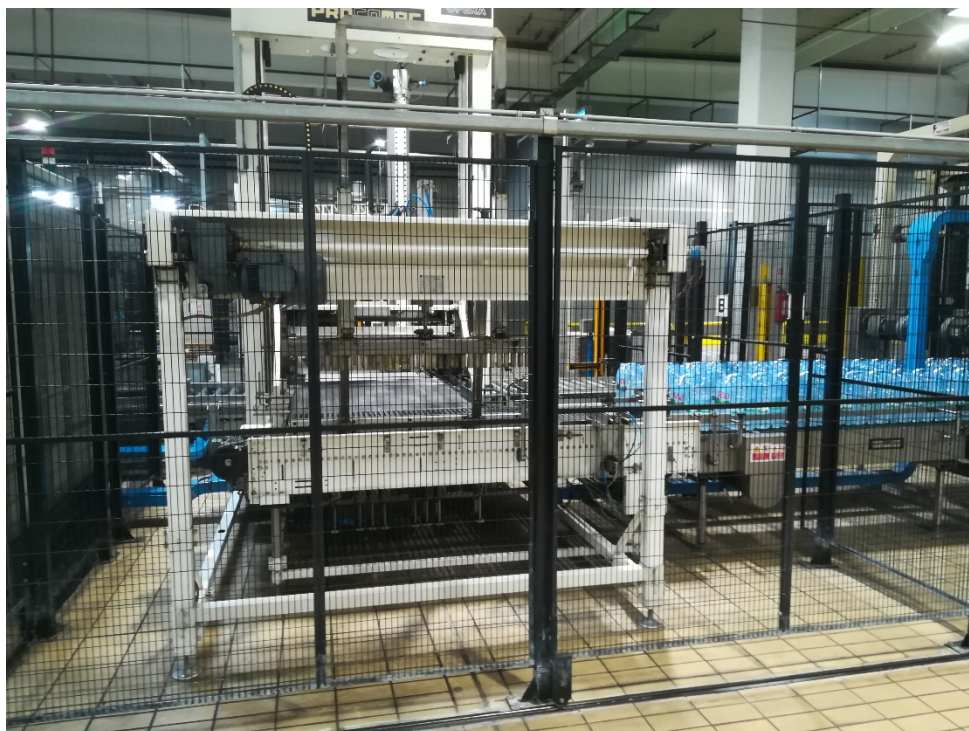
Slika 9. Paletizator.

Paletizator je stroj koji automatski prema zadanom programu slaže pakete na paletu ovisno o dimenziji paketa (slika 9.).