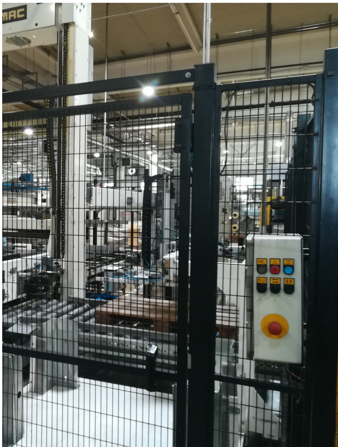
Slika 24. Prikaz tipkala za upravljanje strojem.