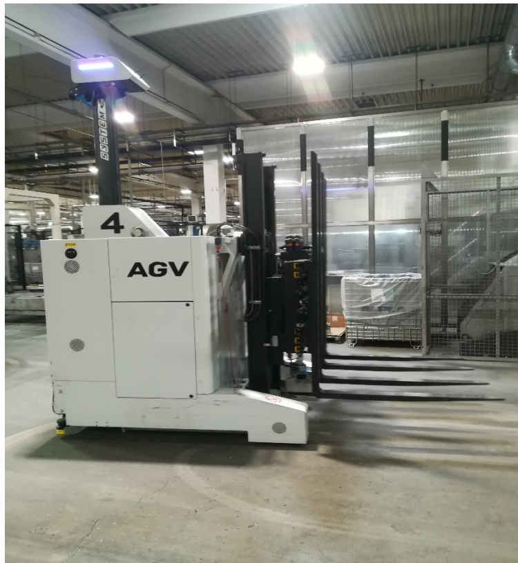
Slika 16. Robot viličar za pogonski dio firme.

U pogonskom dijelu su u uporabi roboti viličari koji predstavljaju manji trošak od klasičnog radnika, u obavljanju rutinskih radnji najčešće točniji od čovjeka, poboljšavaju kvalitetu proizvodnje te minimiziraju potrošnju različitih resursa i ne stvaraju otpad (slika 16.). Isto tako smanjuje se unos štetnih tvari iz vanjske okoline jer se zadržavaju uvijek u istom prostoru, manja je vjerojatnost za ozljeđivanjem radnika koji rade u krugu transportnih puteva te dolazi do smanjenja obujma posla koju su morali obavljati vozači viličara što jako utječe na psihofiziološke i statodinamičke napore [15].