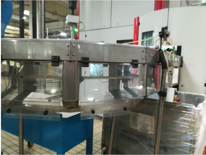
Slika 18. Pokretna traka sa automatskom zaštitom.

Automatske zaštitne naprave, koriste se kada se iz praktičnih razloga ne mogu koristiti niti blokirana niti fiksirana zaštitna naprava (slika 18.). Automatska zaštitna naprava sprječava pristup ruke radnika ili njegovog tijela u zone opasnosti. Obično djeluje kroz sam stroj putem sustava spojeva i poluga [17].