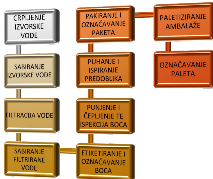
Slika 2. Proces proizvodnje i punjenja izvorske vode [2].

Proizvodni proces je osnova svake industrijske proizvodnje, a podrazumijeva sve aktivnosti i djelovanja koja rezultiraju pretvaranjem ulaznih materijala u gotov proizvod. On obuhvaća i sva sredstva i osoblje na kojima se i sa kojima se vrše aktivnosti od skladišta ulaznog materijala do skladišta gotovih proizvoda. Sastoji se od: tehnološkog procesa, prijevoza ili transportnog procesa, procesa organizacije i procesa informacija, pa predstavlja nedjeljivu cjelinu tehnike, tehnologije, organizacije i ekonomije (slika 2.).