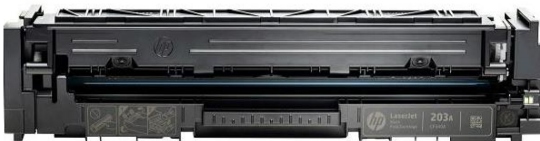
Slika 9 – HP toner laserskog pisača [23]

Slika 9. prikazuje HP toner laserskog pisača.