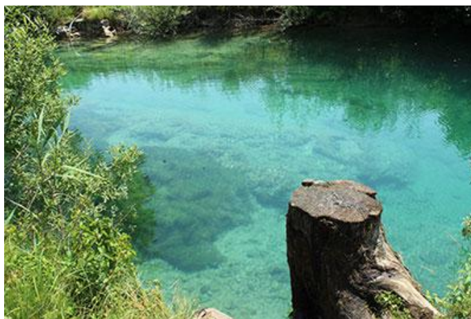
Slika 2 Rijeka Korana, Selo Korana

Na rijeci Korani nalazi se nekoliko većih kupališta: gradsko kupalište u Slunju, gradsko kupalište u Karlovcu (Foginovo), kupalište Korana u Selu Korana te kupalište u Bariloviću. Uz navedena kupališta postoje još i mnoga druga, malo skrivenija. Prosječna temperatura rijeke Korane koja je još u 19. stoljeću potvrdila svoju ljekovitost, u ljeti iznosi 24 °C. Najljepšu boju i najbistriji tok moguće je vidjeti u Selu Korana gdje su svaka ribica i svaki kamenčić vidljivi potpuno jasno, a kupalištima je moguće pronaći i dodatne sportske sadržaje kao što su boćanje, odbojka na pijesku ili vježbanje na spravama.