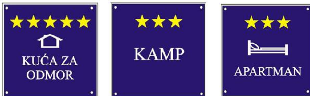
Slika 1. Primjer ploča sa oznakom vrste i kategorije objekta