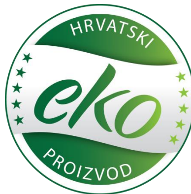
Slika 4: Oznaka hrvatskog ekološkog proizvoda