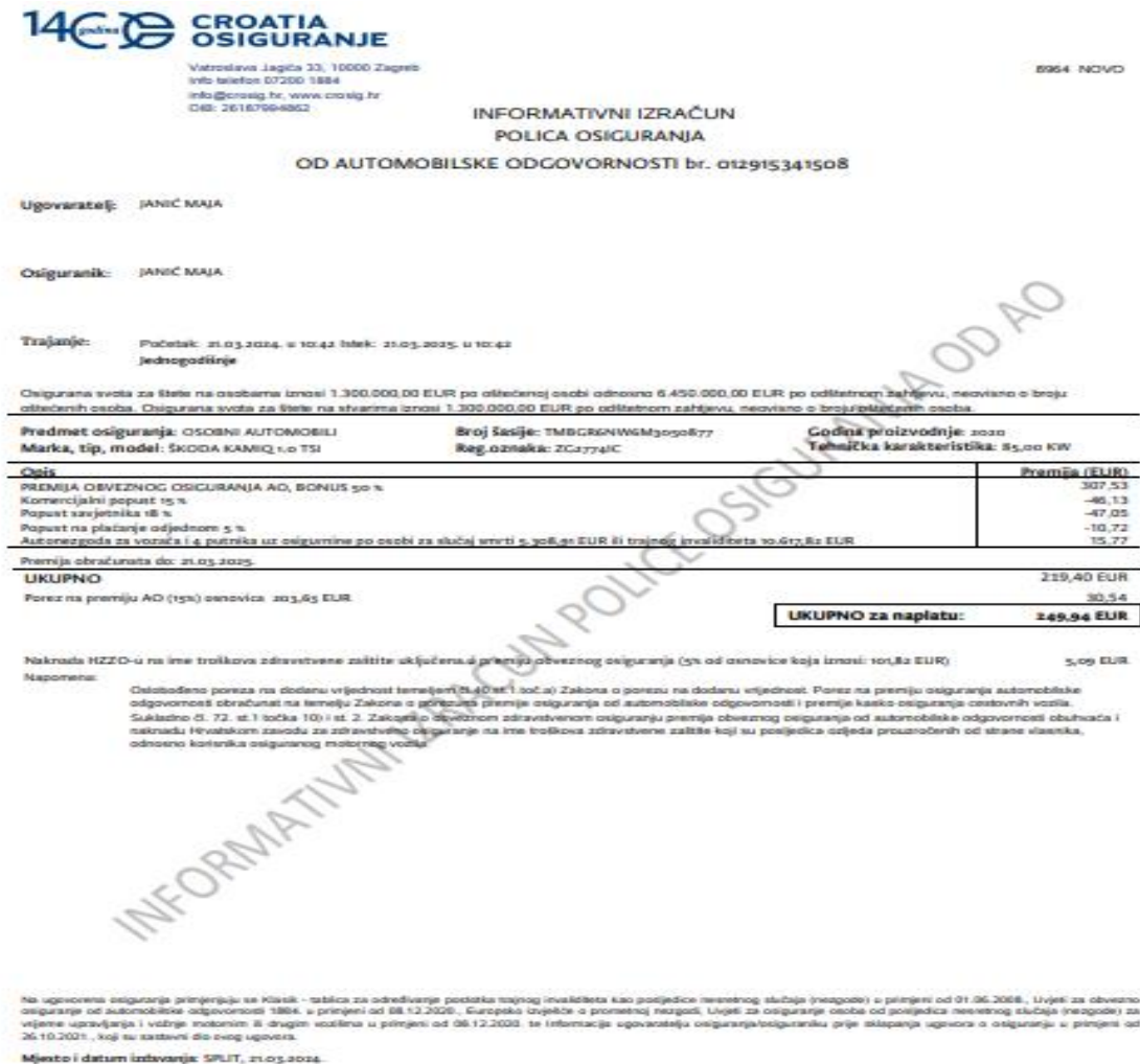
Slika 7- Informativni izračun police osiguranja od automobilske odgovornosti – Croatia osiguranje