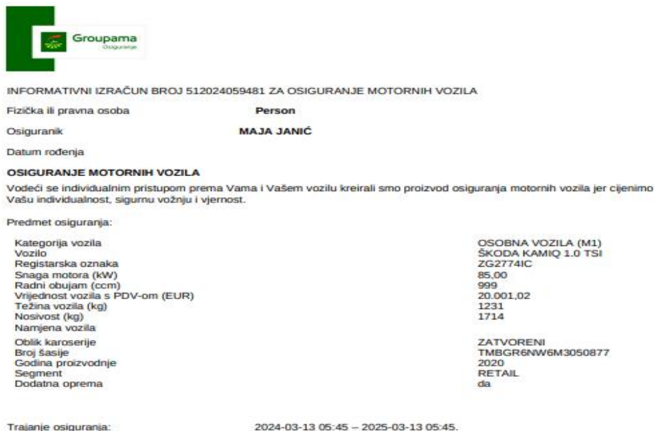
Slika 6 - Informativni izračun police za osiguranje motornih vozila – Groupama osiguranje

Groupama osiguranje nudi policu kasko osiguranja koja uključuje franšizu, što znači da osiguranik snosi dio troškova štete na vozilu prije nego što osiguravajuće društvo preuzme preostali iznos. Ova polica osigurava osnovnu zaštitu od automobilske odgovornosti, kao i pokriće štete na vlastitom vozilu, uključujući i krađu. Uz osnovnu kasu pokriva, dostupne su i dodatne opcije poput osiguranja od nesretnog slučaja, zaštite bonusa i asistencije na cesti, čime se osigurava sveobuhvatna zaštita koja pokriva sve ključne aspekte sigurnosti.