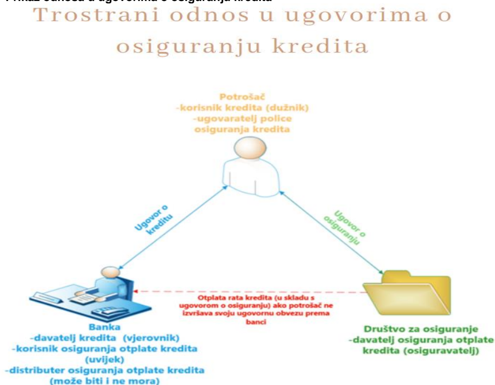
Slika 3 - Prikaz odnosa u ugovorima o osiguranju kredita