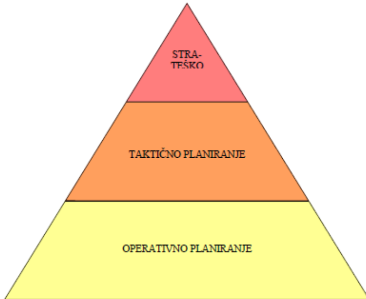
Slika 2. Razine planiranja

Izvor: Buble, M., Osnove menadžmenta, Zagreb, 2006., Sinergija, str. 88.