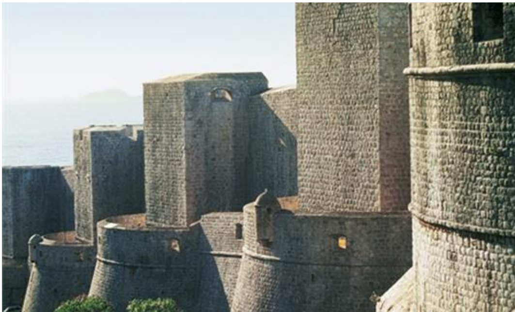
Slika 5: Dubrovačke gradske zidine