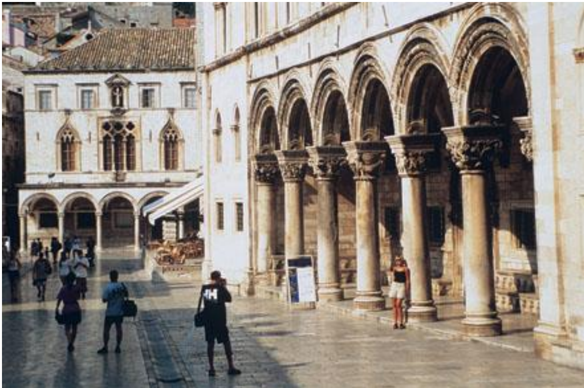
Slika 8: Knežev dvor