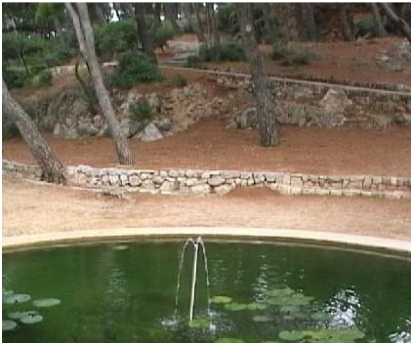
Slika 4: Park Gradac