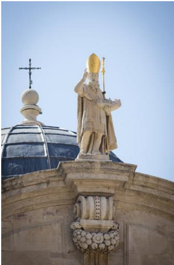
Slika 12: Kip svetog Vlaha