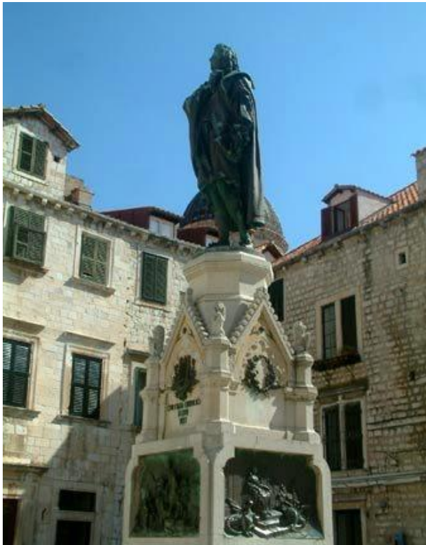
Slika 6: Spomenik Ivana Gundulića