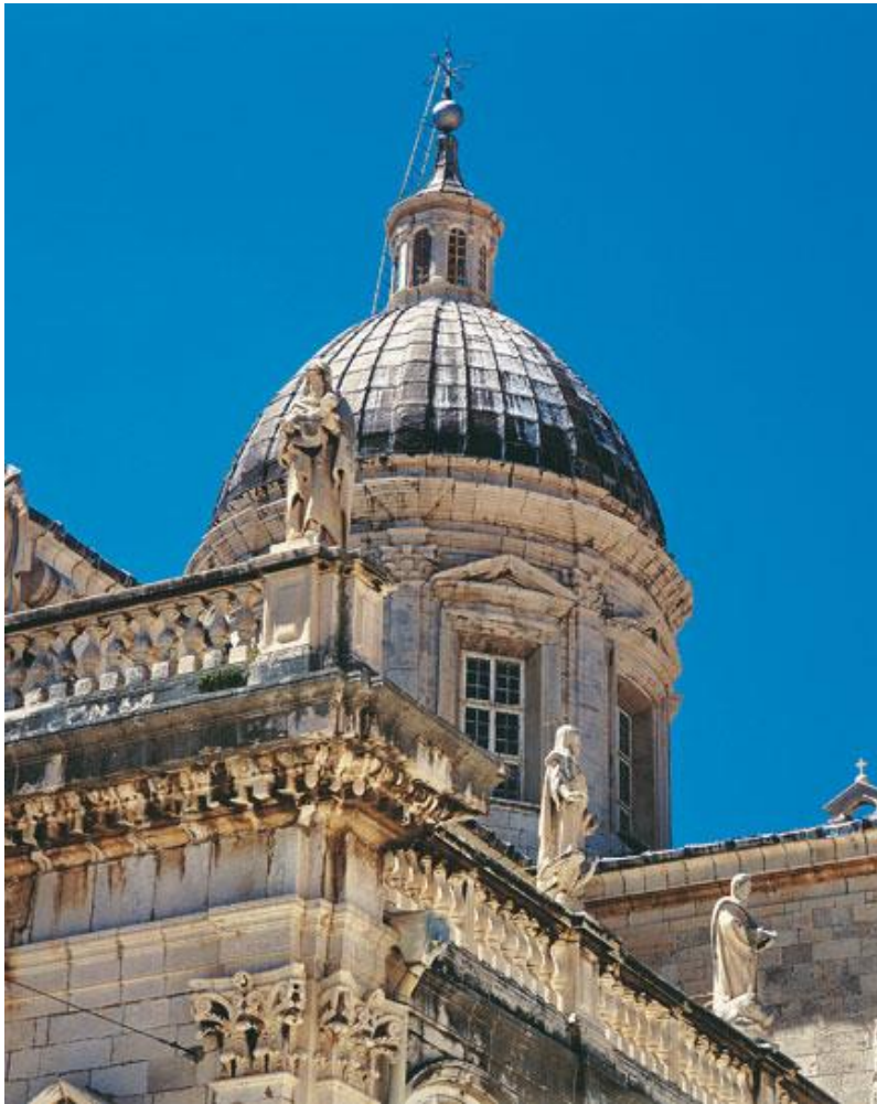
Slika 10: Katedrala