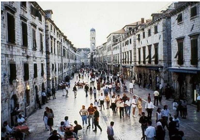
Slika 13: Stradun