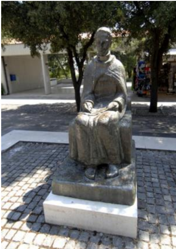
Slika 7: Skulptura Marina Držića