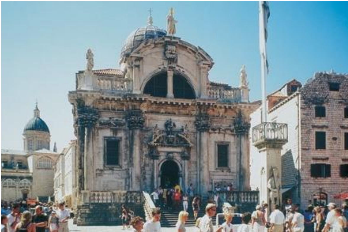
Slika 11: Crkva sv. Vlaha