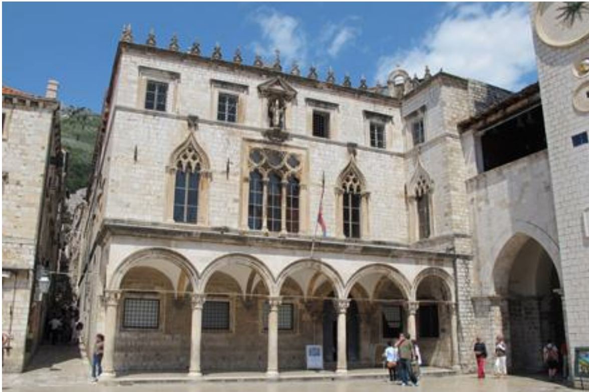
Slika 9: Palača Sponza