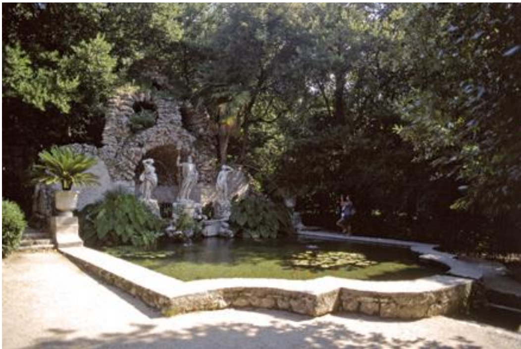
Slika 2: Arboretum Trsteno