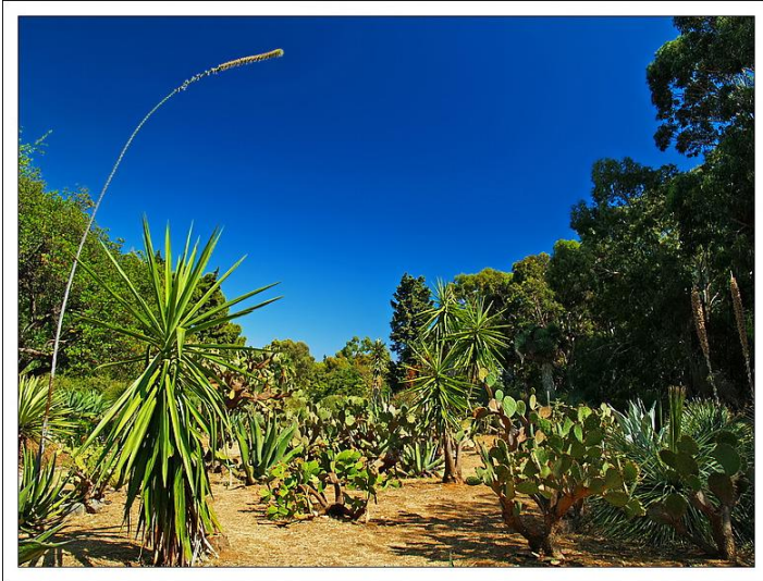
Slika 3: Botanički vrt na Lokrumu