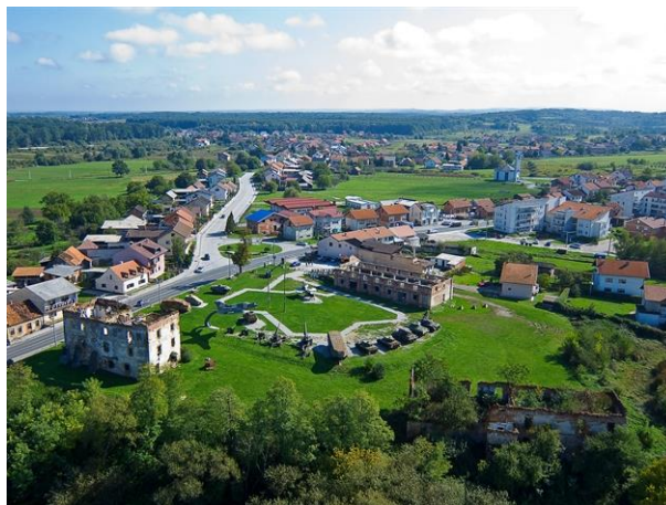
Slika 12. Muzej Domovinskog rata na Turnju

Ratna zbivanja u Domovinskom ratu potvrdila su Turanj kao predstražu Karlovaca. Na Turnju su 90-ih godina prošlog stoljeća hrvatski branitelji slomili agresorske pokušaje da se zauzme grad Karlovac, tu su se vodili mnogi pregovori o uspostavljanju primirja, razmjenjivali zarobljenici, prihvaćali izbjeglice i prognanici. Turanj je simbol pobjede, povratka i novog života na ratom opustošenom području.