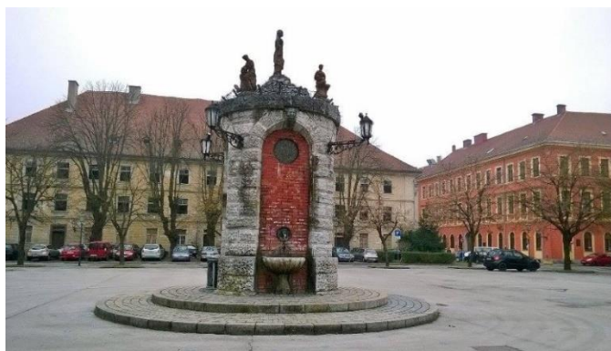
Slika 8. Zdenac na Trgu bana Josipa Jelačića u Zvijezdi