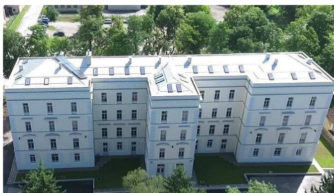
Slika 16. Hostel Bedem u Karlovačkoj Zvijezdi