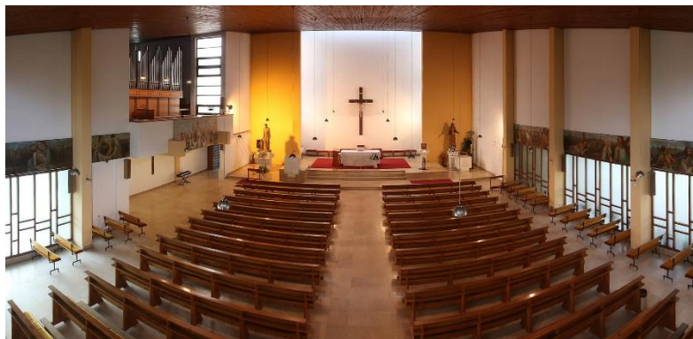
Slika 11. Unutrašnjost crkve sv. Josipa na Dubovcu