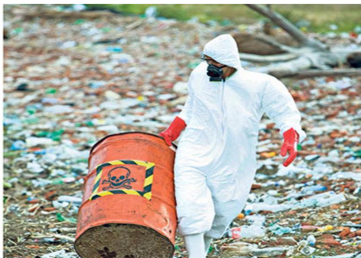
Slika 2. Opasni otpad

Zakonom o otpadu definira se način skladištenja i prijevoz opasnog otpada. Osnovno je da se opasni otpad mora izdvojeno sakupljati i skladištiti na strogo kontroliranim i u skladu sa Zakonom opremljenim prostorima. Prijevoz opasnog otpada mora biti isključivo u skladu s propisima koji vrijede za prijevoz opasnih tvari. Obrada opasnog otpada dozvoljena je samo u postrojenjima koja posjeduju sve zakonom propisane uvjete i dozvole.