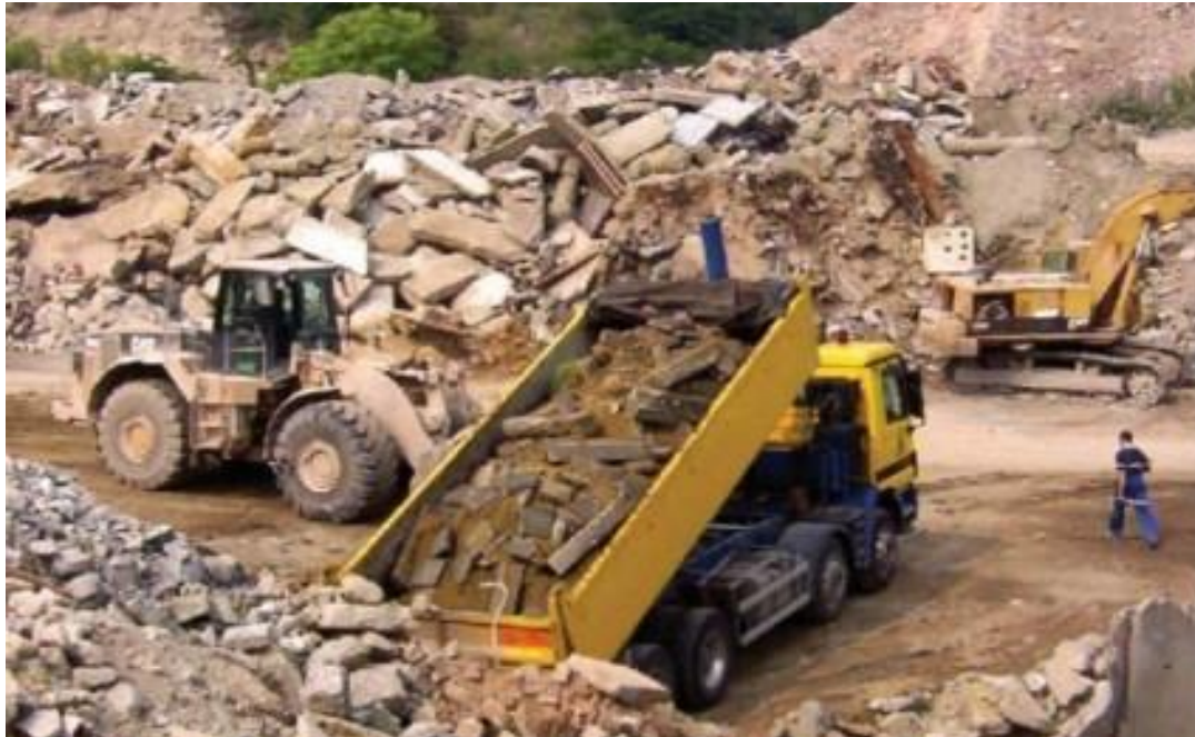
Slika 4. Građevinski otpad