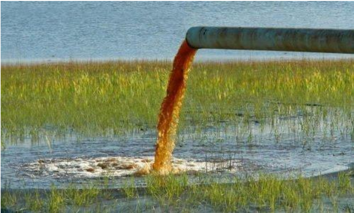
Slika 3. Poljoprivredne otpadne vode [3]