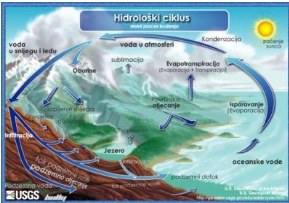
Slika 1. Ciklus kruženja vode u prirodi (hidrološki ciklus) [1]

Vidljivo je da voda prolazi kroz različite cikluse koji se neprestano stvaraju i nestaju a cirkulacija procesa također utječe na cirkulaciju onečišćenja.