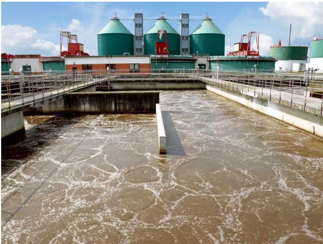
Slika 2. Industrijske otpadne vode [2]

Na slici 2. u nastavku vidljiv je prikaz industrijskih otpadnih voda.