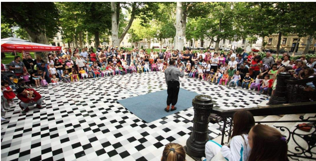
Slika 9: Cest is d best