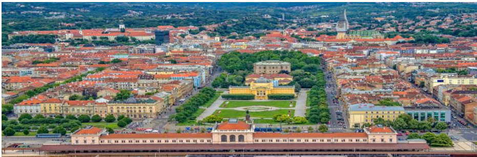
Slika 1: Grad Zagreb