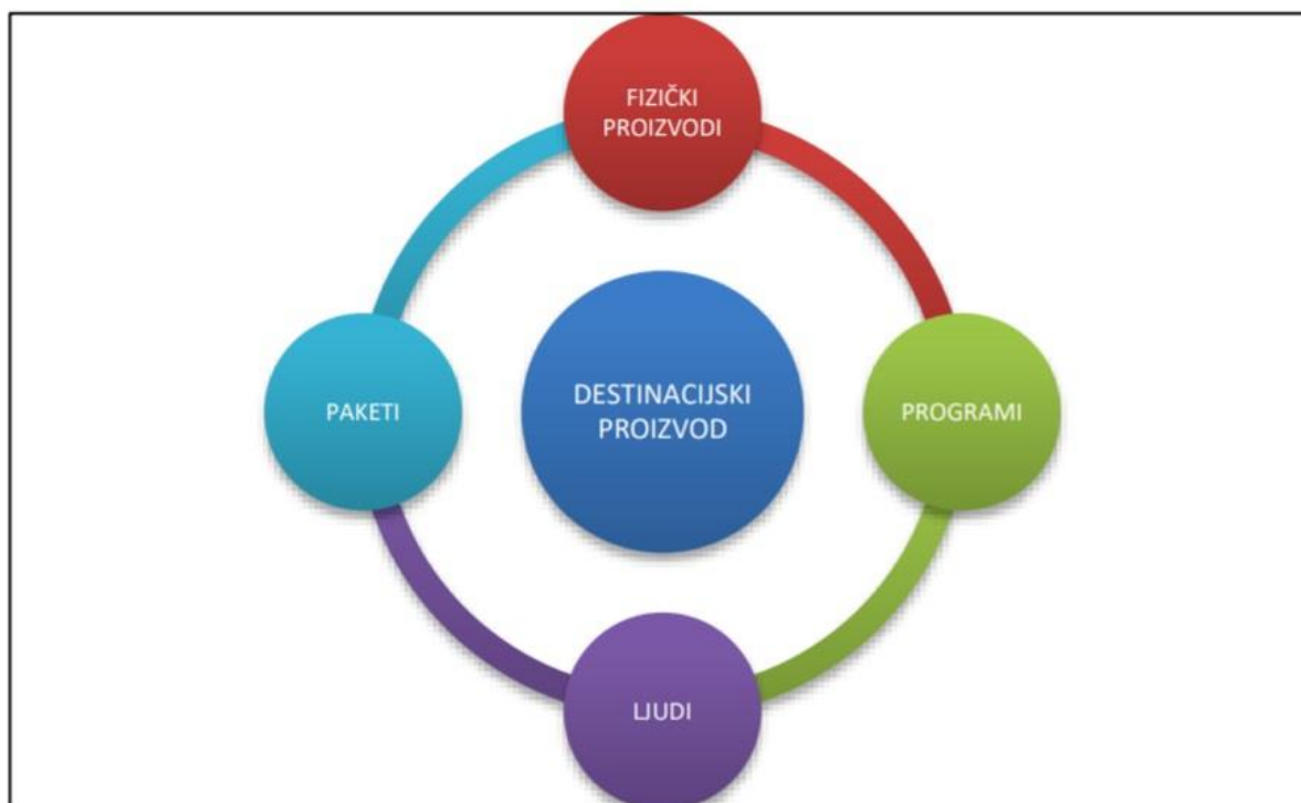
Slika 3: Destinacijski proizvod

Izvor: Magaš D., Menadžment turističke destinacije i organizacije, Fakultet za menadžment u turizmu i ugostiteljstvu, Opatija 2018., str.34.