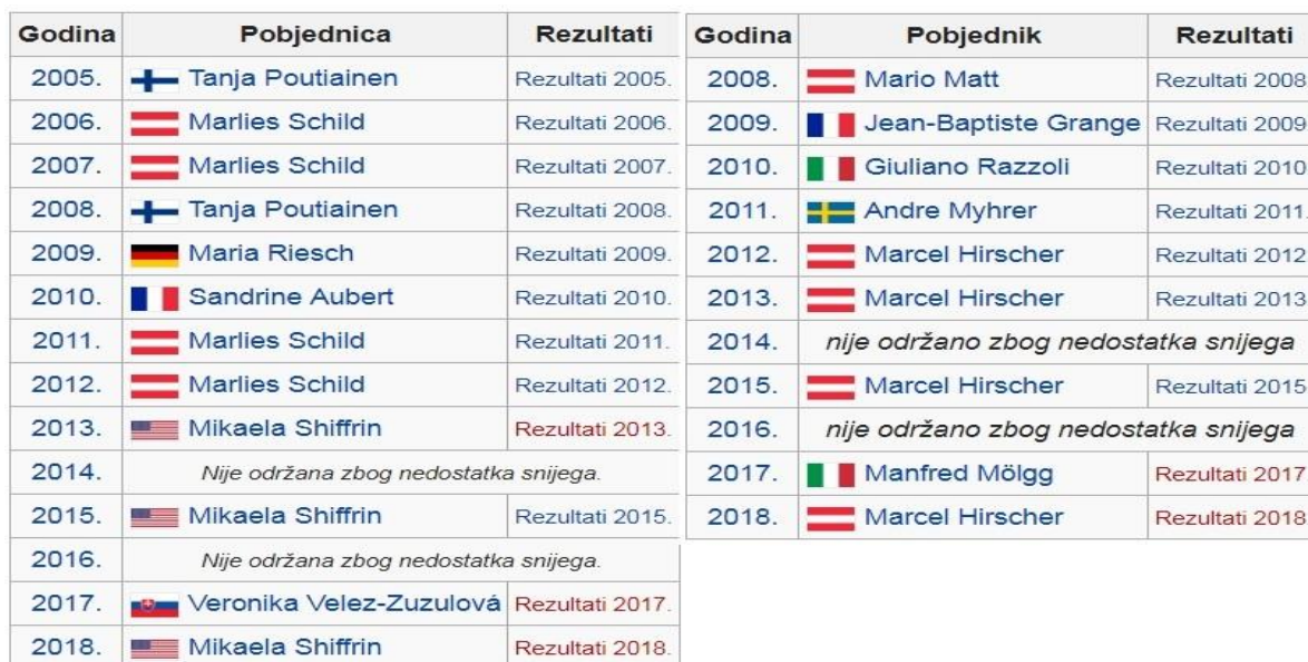
Slika 13: Muški i ženski pobjednici od osnivanja utrke