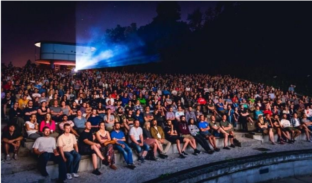
Slika 12: Zagreb film festival