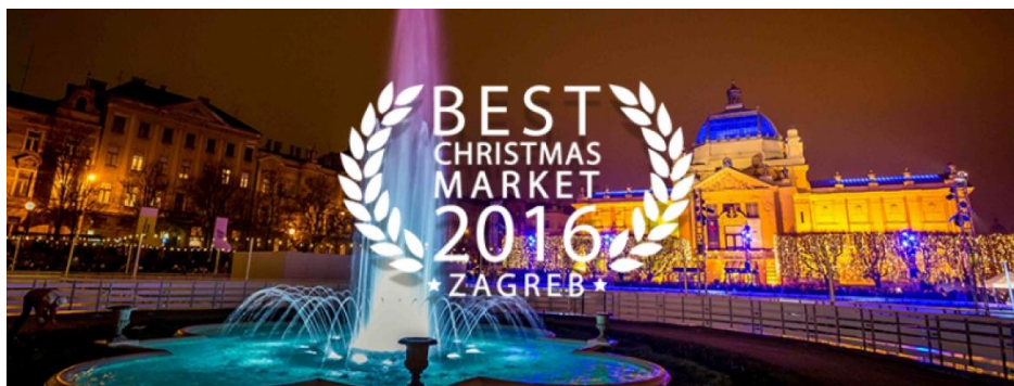
Slika 5: Logo za prestižnu nagradu Najbolji Božićni sajam