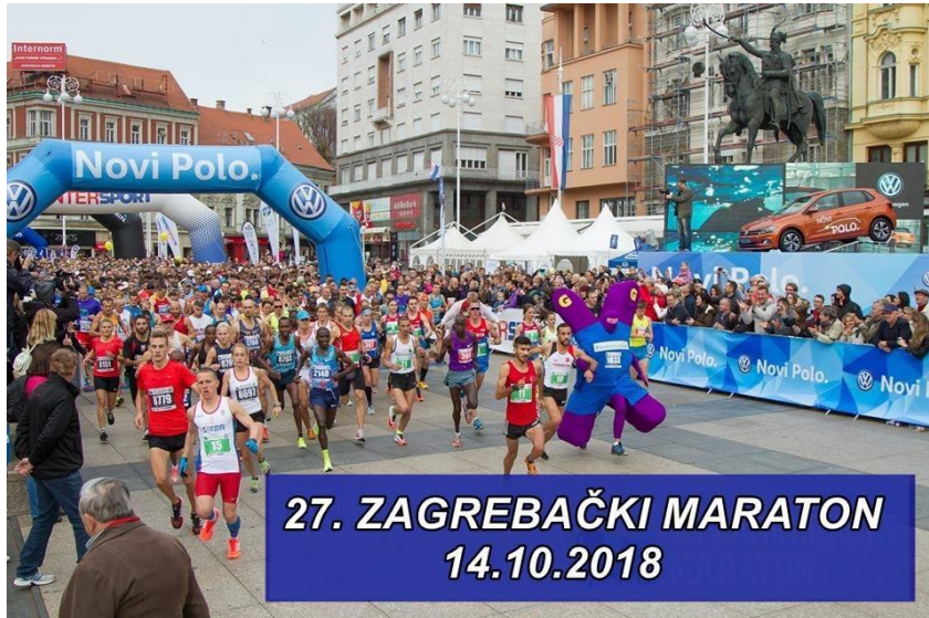
Slika 6: start Zagrebačkog maratona 2018.