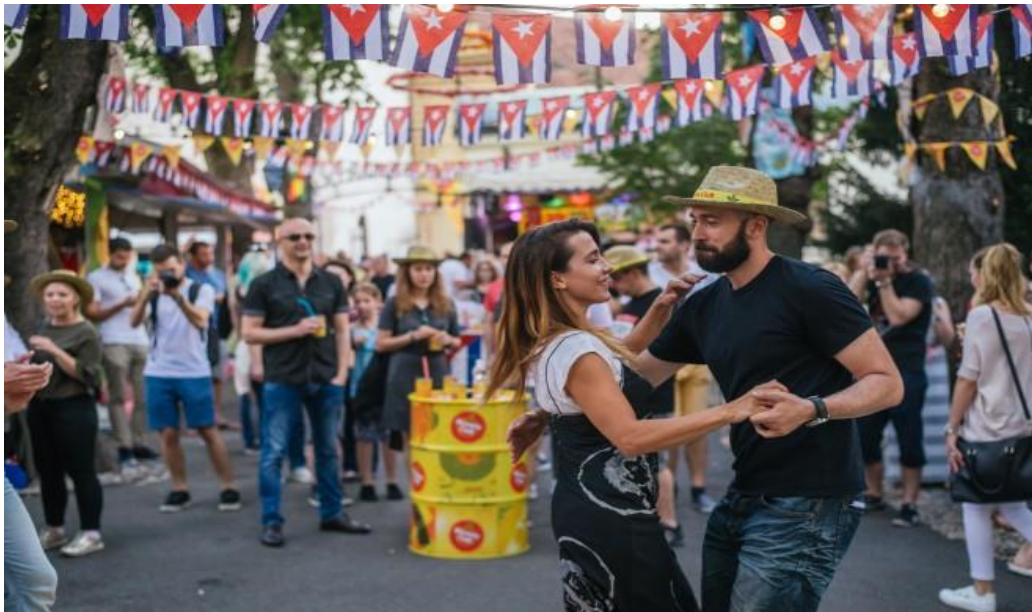
Slika 8: Ljeto na štroso