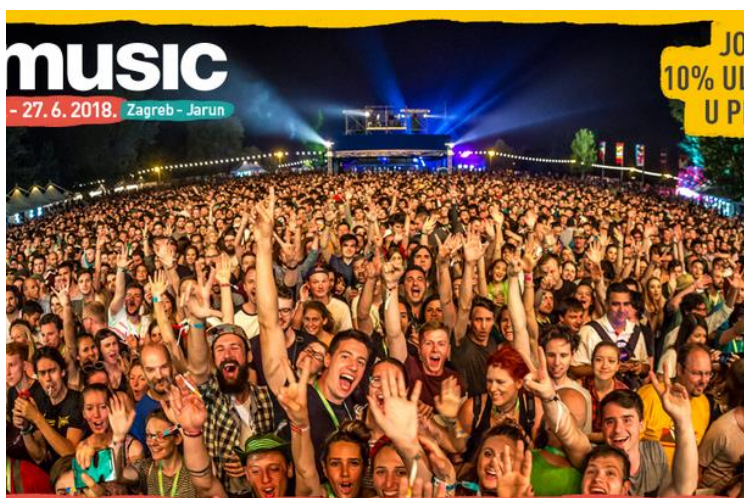
Slika 11: INmusic festival