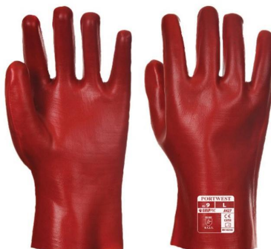
Slika 12. Zaštitne rukavice pri radu s kemikalijama [izvor: https://invictus-arena.com/collections/zastitna-oprema/products/kemijska-rukavica-a435?variant=7197498441773 ]

Ako poslodavac sastavlja dijelove radne opreme u funkcionalnu cjelinu ili radnu opremu prepravlja tako da joj promijeni osobine i funkcionalnost, tada postaje proizvođač radne opreme i na njega se primjenjuju propisi koji vrijede za proizvođače radne opreme.