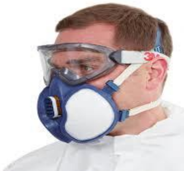
Slika 16. Zaštitna maska pri radu s kemikalijama

Radna oprema se smije upotrebljavati samo za radne zadatke i pod uvjetima za koje je namijenjena. Pri izboru radne opreme moraju se uzimati u obzir prisutne opasnosti i štetnosti na mjestu rada, odnosno druge opasnosti i štetnosti koje mogu nastati pri uporabi radne opreme.