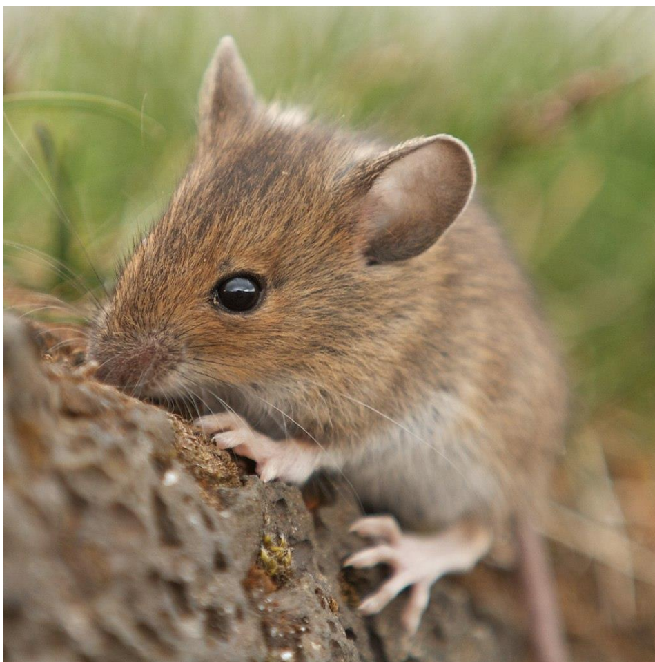
Slika 4. Šumski miš

Šumski miš ( Apodemus sylvaticus ) izgledom je slična vrsta žutogrlom šumskom mišu. Nešto je manja i rep ne prelazi dužinu tijela, dok na vratu nedostaje ili je prisutna žuta pjega. Iako samo ime šumski miš naglašava njeno stanište, za razliku od žutogrllog šumskog miša ova vrsta nastanjuje i druge tipove staništa. Aktivna je noću i izvrstan je penjač, štete čini na šumskom sjemenu.