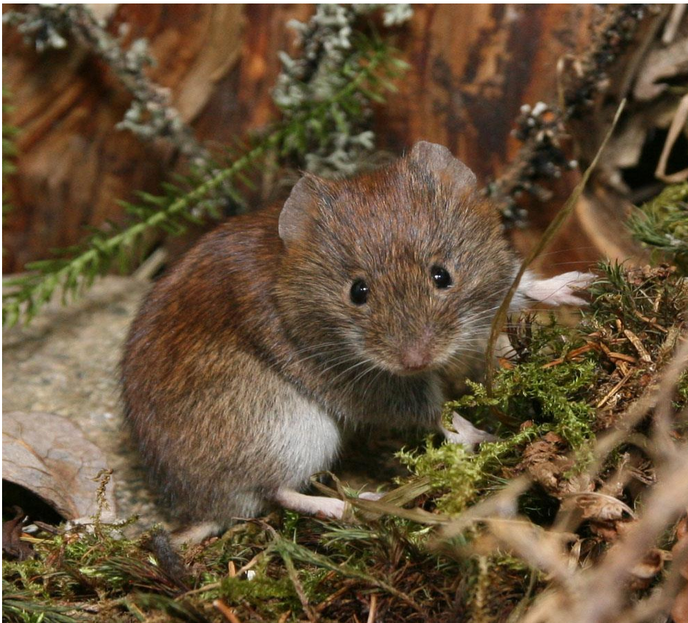
Slika 5. Šumska voluharica

Šumska voluharica ( Myodes glareolus ) je najrasprostranjenija vrsta unutar porodice voluharica. Tipičan je stanovnik šuma i šumskih rubova. Za razliku od drugih voluharica ova vrsta je arborealna te često traži hranu na drveću i u krošnjama. Aktivna je tijekom noći, sumraka i zore. Brlog se najčešće nalazi pod zemljom i često se nalazi ispod panjeva i korijena prevrnutog drveća. Ova vrsta se lako raspoznaje od drugih voluharica svojom specifičnom crvenkastosmeđom obojenošću i dugim repom. Brojnost populacije ove vrste u šumama ovisi o urodu šumskog sjemena. Štete čini na kori drvenastih vrsta (pomladka).