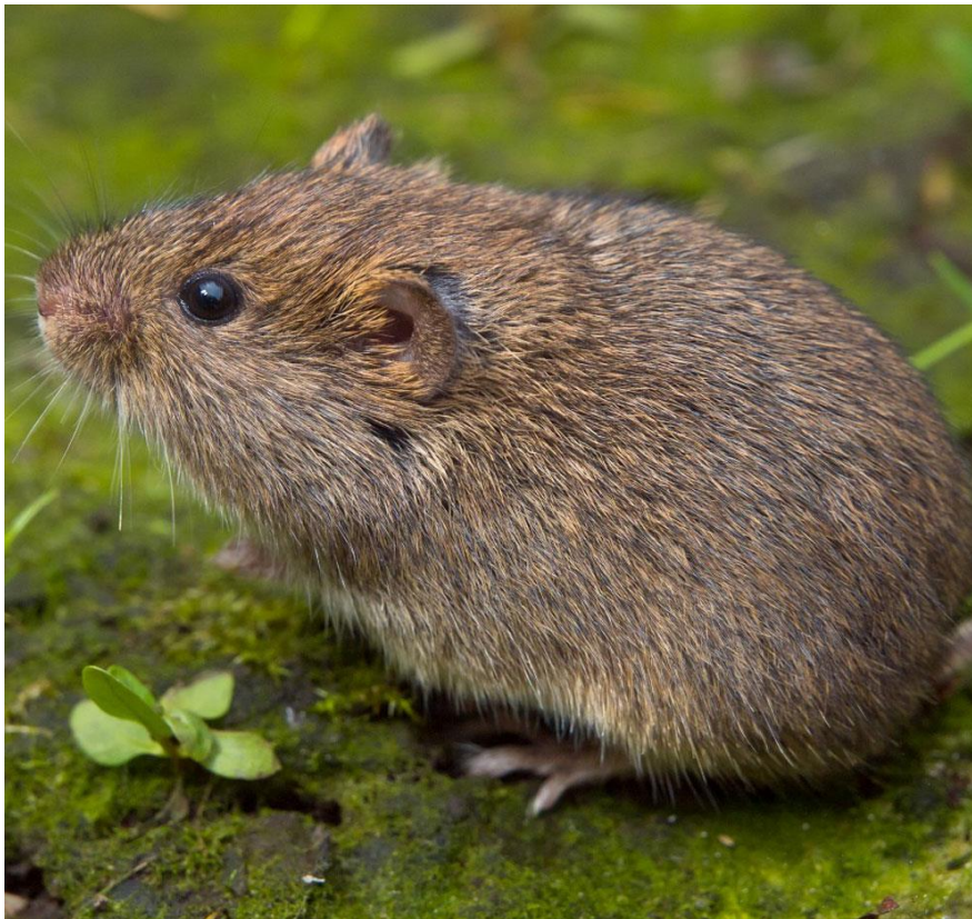
Slika 8.Livadna voluharica

Livadna voluharica ( Microtus agrestis ) preferira vlažna staništa bogata vegetacijom. Često ju se može naći i u šumama, na otvorenim površinama gusto obraslima travom. Za razliku od poljske voluharice, koja joj je izgledom jako slična, ova vrsta ima uške do pola ili u potpunosti pokrivene krznom. Aktivna je i noću i danju, a najveću aktivnost pokazuje u sumrak i zoru. Ova vrsta gradi kuglasta gnijezda od izgrizene trave. Gnijezda se nalaze na površini u travi tijekom suhih ljeta, a za vrijeme hladnih i vlažnih perioda ispod zemlje.