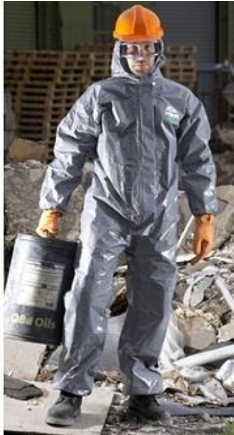
Slika 15. Zaštitno odijelo pri radu s kemikalijama

Ako sigurnost i zdravlje radnika u opasnom području radne opreme nije osigurano konstrukcijskim rješenjima, tada se moraju poduzeti odgovarajuće tehničke mjere zaštite (zaštita, zaštitni uređaj i dr.) radi sprečavanja ulaska radnika u opasno područje radne opreme za vrijeme rada.