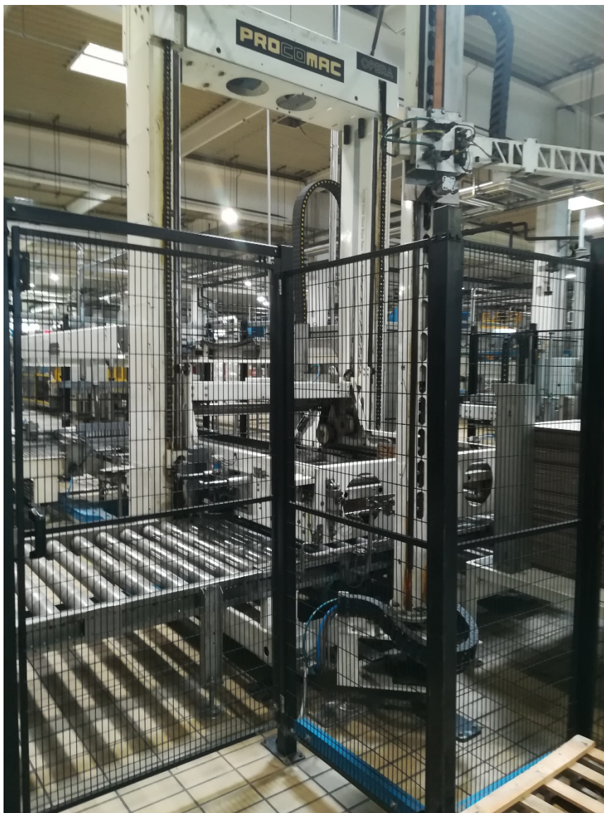
Slika 22. Zaštitna ograda oko paletizatora.

Prvo što primjećujemo da oko stroja i linije se nalazi zaštitna ograda koja služi za zadržava radnike dalje od radnog prostora stroja (slika 22.). Ograda koja ograđuje stroj spada u čvrste i/ili nepomične zaštitne naprave.