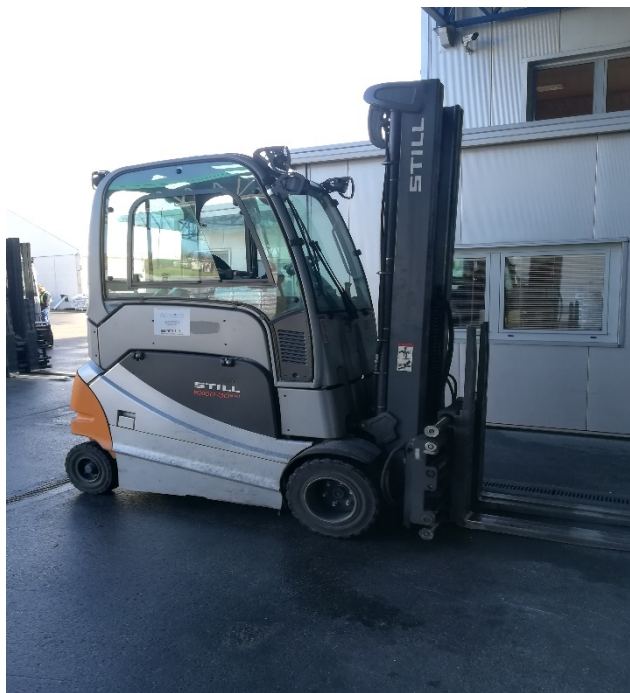
Slika 15. Viličar za skladišni prostor i utovar kamiona.