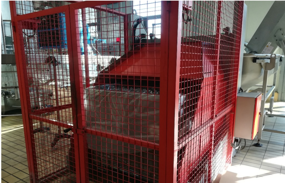
Slika 5. Spremnik za predobljke.