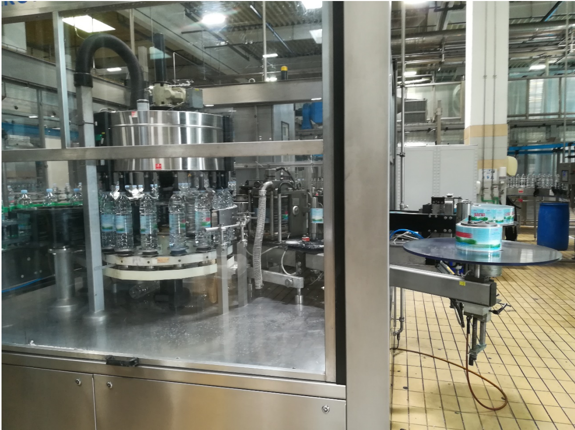
Slika 7. Stroj za ljepljenje etiketa.

Stroj koristi prethodno uvedene etikete iz role koje samostalno reže okretnim nožem i lijepi na boce pomoću ljepila koje se nalazi u spremniku unutar stroja. Nakon etiketiranja, proizvod se transportira do stroja za upakiravanje proizvoda (slika 8.).