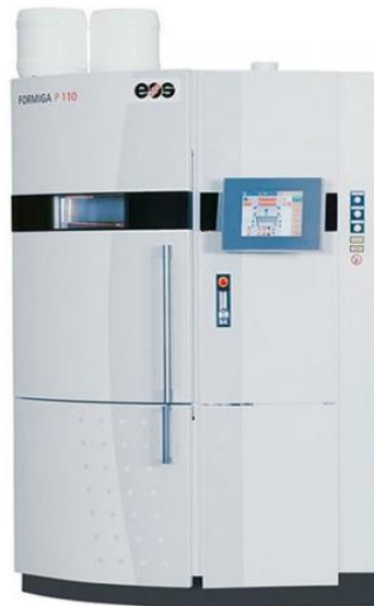
Slika 6 - Eos Formiga P 110 Velocis [13]