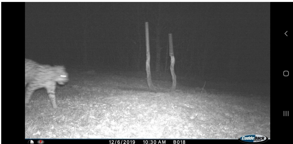
Slika br. 4: Primjer fotografije problematične za identifikaciju