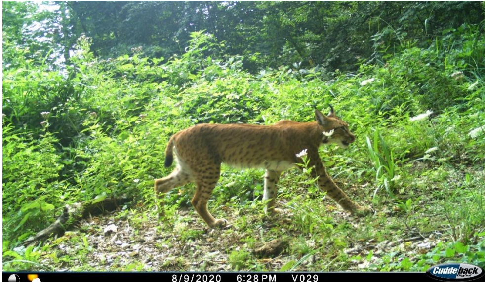
Slika br. 3: Ris Novi Sveto Brdo snimljen na šumskoj vlaci