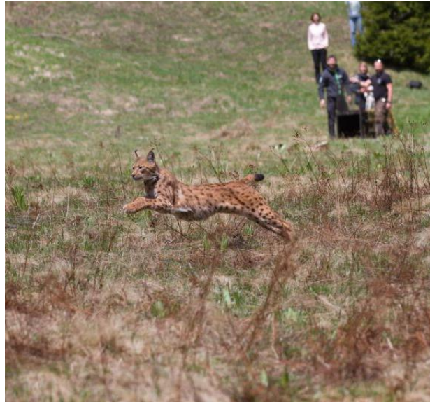
Slika br. 2 Ispuštanje risa Emila u okviru projekta LIFE Lynx