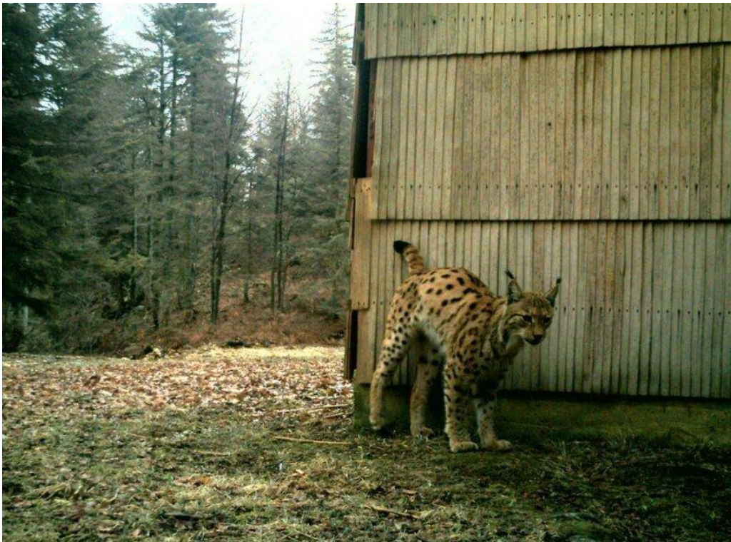
Slika br 1: Euroazijski ris na markiralištu

Ris je najveća europska divlja mačka te po sistematici spada u : razred sisavaca ( Mammalia ), red mesoždera ( Carnivora ), porodice mačaka ( Felidae ), potporodice pravih mačaka ( Felinae ), roda mačke ( Felis ) te vrsta obični ili euroazijski ris ( Lynx lynx ). Osim euroazijskog risa Europu još nastanjuje i iberijski ris ( Lynx pardinus ) i može ga se naći samo na Iberijskom poluotoku, dok je euroazijski ris rasprostranjen na području od Skandinavije, preko Baltičke regije, Srednje i Istočne Europe, Dinarida i Balkana do Anatolije, Irana, Iraka, Sjeverne i Srednje Azije. Širokim geografskim rasponom ris obuhvaća i različita staništa; stepe, polupustinje, šume umjerenog pojasa, tajge, a na Himalaji čak i područja iznad pojasa šume.