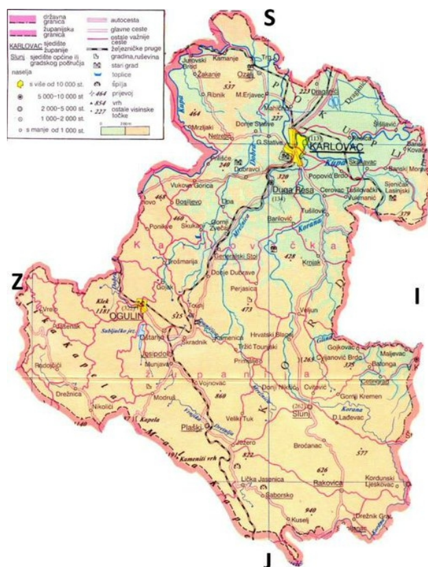
Slika 1: Prikaz reljefa Karlovačke županije