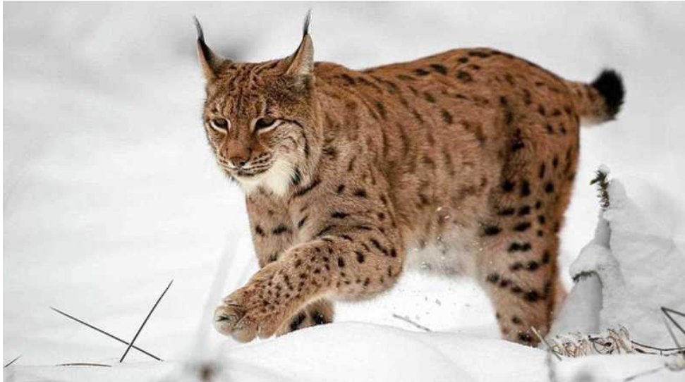
Slika 1. Euroazijski ris (autor: Nick Huisman)

Kao i sve prave mačke ris može uvući pandže u šapu, tako da se iste ne vide u otiscima nogu. Pandže ris koristi u hvatanju i deranju plijena, obilježavanju stabala i penjanju. Ris ima 28 zuba uz zubnu formulu I\ 3 / 3 , C\ 1 / 1 , P\ 2 / 2 , M\ 1 / 1 . Zubalo je građom karakteristično za mesojede (JANICKI i sur., 2007).