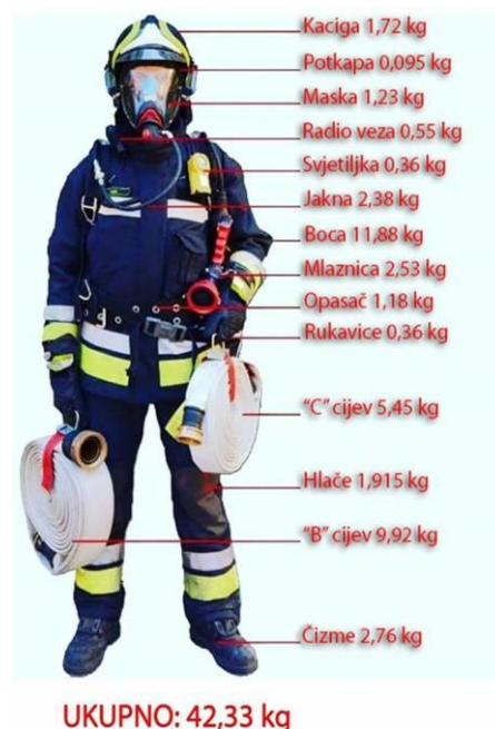
Slika 19. Osobna zaštitna protupožarna oprema [3]