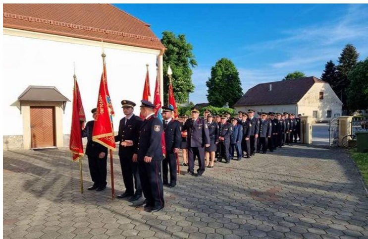
Slika 30. Svečani mimohod s obljetnice 110 g. djelovanja DVD-a Petrijanec [14]

Osim primarne uloge spašavanja ljudi i imovine od požara i tehničkih intervencija, dobrovoljna vatrogasna društva su i nositelji kulture u svojoj zajednici. [14]