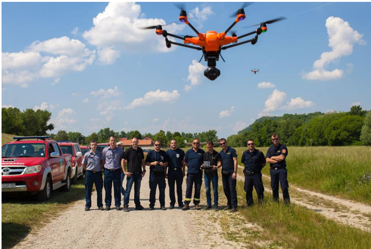
Slika 29. Беспилотна летјелца – дрон [9]

kojom se opskrbljuje vodom. Penje se na visinu od 300 m za 6 min i doseže nepristupačna mjesta, što je pogodno za gašenje požara visokih objekata.