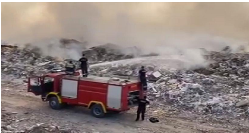
Slika 1. Požar smetlišta [1]

Pod pojmom otvorenog prostora u vatrogastvu drže se svi prostori koji nemaju zatvorene fizičke ograde i gdje ima dovoljne količine kisika iz zraka za potpuno sagorijevanje gorive tvari. Požarima otvorenog prostora podrazumijevaju se poljski požari, šumski požari i ostali požari na otvorenom prostoru. U požare na otvorenom prostoru uvrštavaju se i požari kod plinskih i naftnih postrojenja, požari otvorenih skladišta, požari smetlišta. Kod požara smetlišta (slika 1.) kao požara na otvorenome, osobito se pridaje pozornost preventivi i sigurnosti od požara jer su te lokacije iznimna potencijalna mjesta stvaranja i širenja požara.