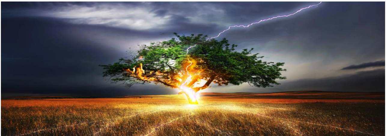
Slika 11. Požari pojedinačnih stabala [11]

Požari pojedinačnih stabala obično nastaju udarom groma u osamljena stabla koja se zapale i kao takva izgore u obliku buktinje. Rjeđe se dogodi da prenese požar na šire okolno područje. (slika 11.) [11]