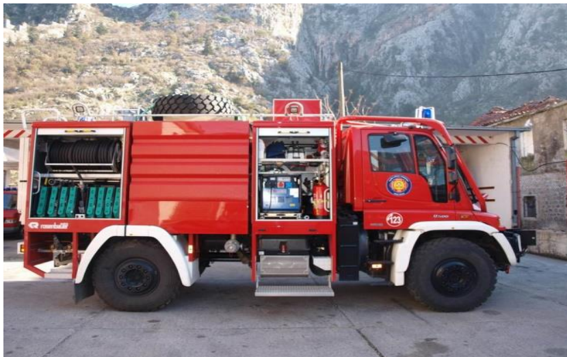
Slika 22. Unimog [12]

Unimog vozilo predstavlja navalno protupožarno vozilo (slika 22.) za gašenje šumskih požara i požara otvorenog prostora, prilagođeno zahtjevnim terenskim uvjetima.