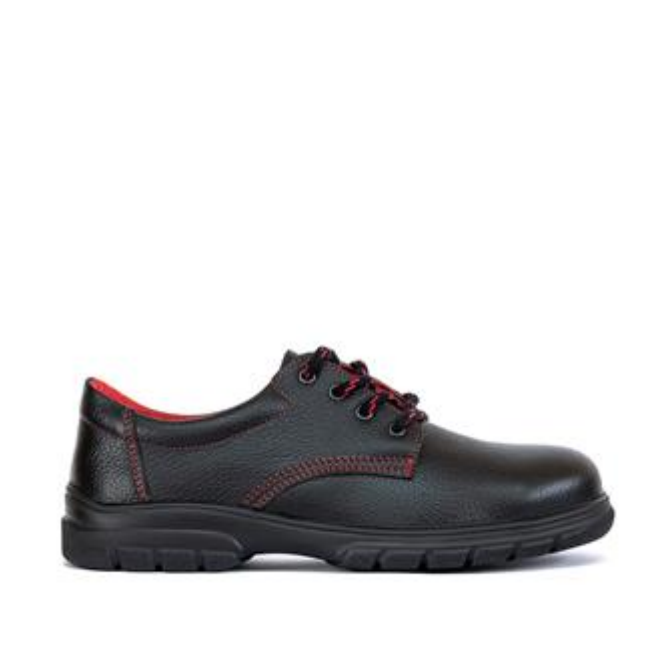
Sl. 6 Zaštitna cipela, niska [19]

Osobna zaštitna oprema za zaštitu nogu i stopala služe za zaštitu od hladnoće, uboda, sklizanja, kemikalija te padova teških predmeta.