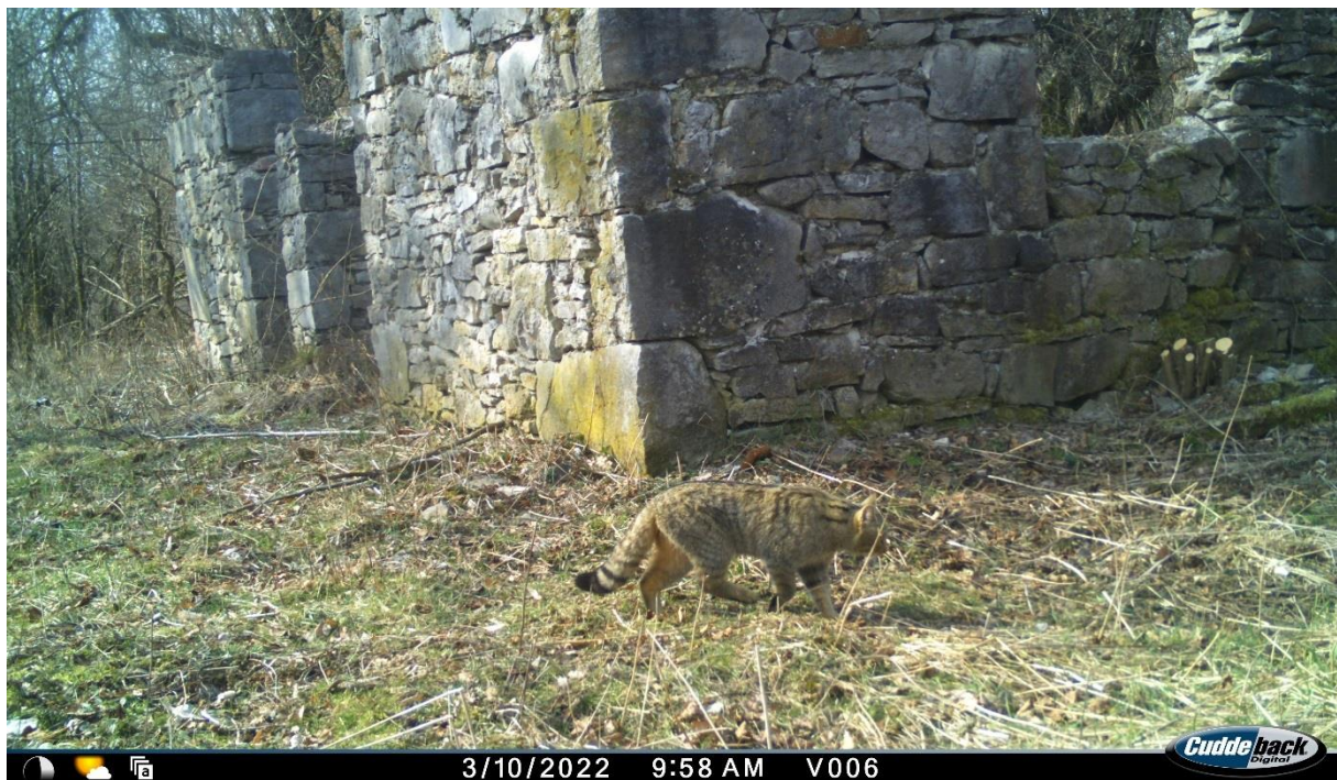
Slika br. 4 Divlja mačka ( Felis silvestris )