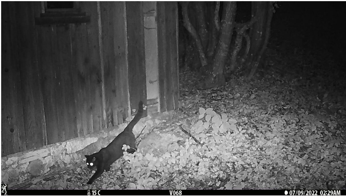
Slika br. 5 Domaća mačka ( Felis silvestris forma catus )