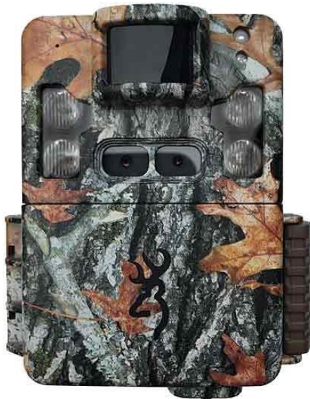
Slika br. 2 Browning trail cameras model btc-5pxd