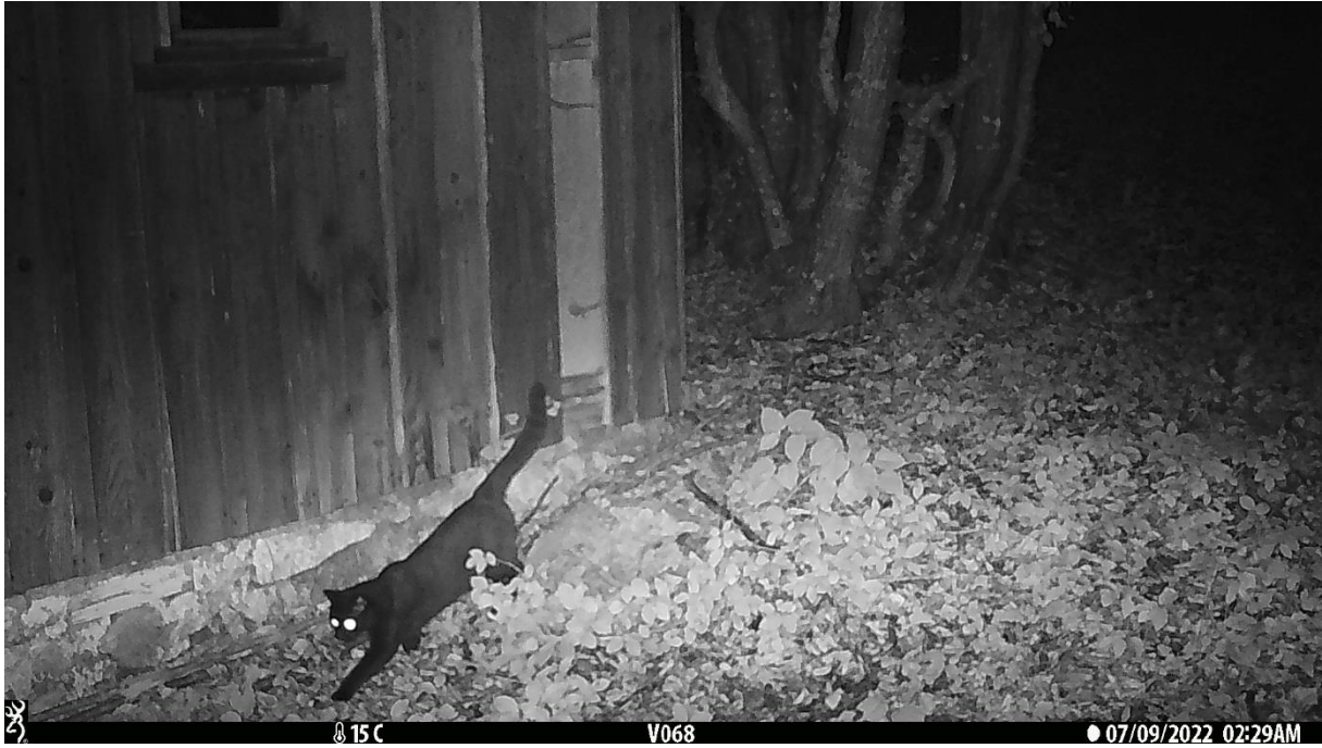
Slika br. 5 Domaća mačka ( Felis silvestris forma catus )