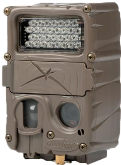
Slika br. 1 Cuddeback Long Range IR, Model 1224