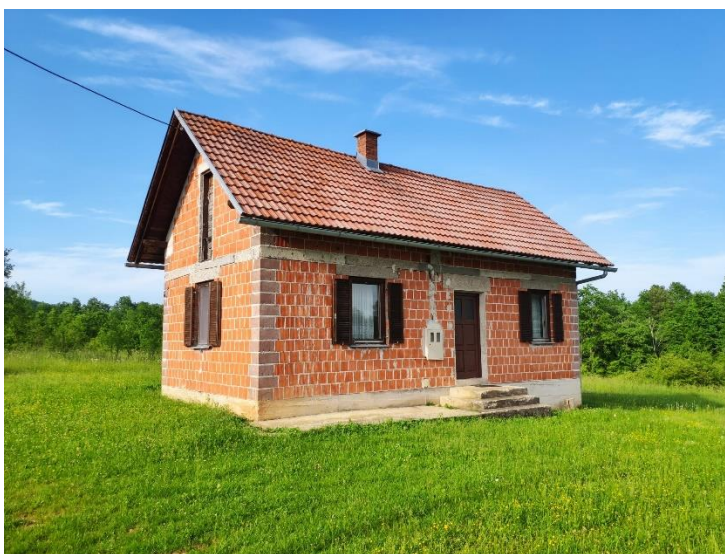
Slika 4. Kuća za odmor "Viva Rastoke"

Kuća uzeta kao konkretan primjer u pisanju ovog rada je postojeći objekt na kojemu je potrebna adaptacija i prilagodba uvjetima Pravilnika o razvrstavanju i kategorizaciji objekata u kojima se pružaju ugostiteljske usluge u domaćinstvu (slika 2).