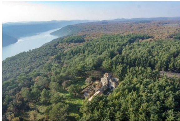
Slika 6. Šuma Kontija i gradina Mukaba