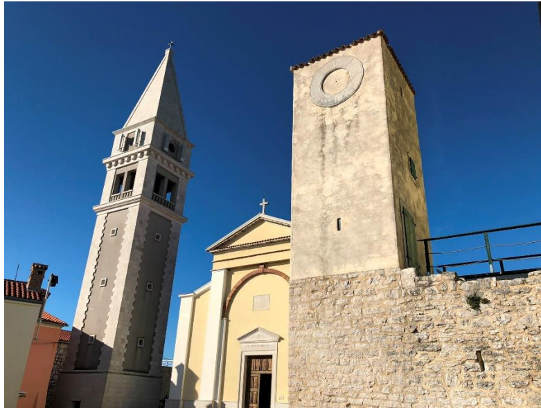
Slika 9. Vrsarski kaštel